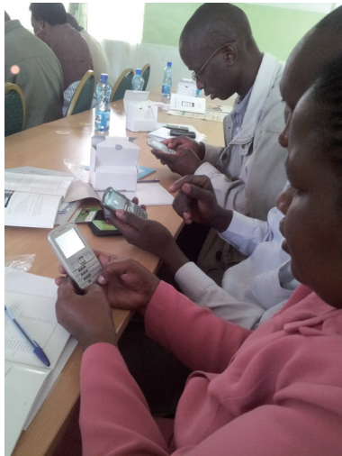
アウトブレイク警戒システム研修