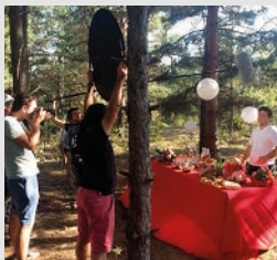
Projekat razvoja kapaciteta Radio televizije Kosova (RTK)