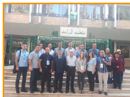
Prvi kurs pod nazivom „Opšti principi higijene hrane (dobra proizvodna praksa i sistem HACCP)“ sproveden je na Univerzitetu u Jordanu u 2017.

hranu i veterinarstvo (KFVA) koji su učestvovali u programu obuke JICA 2012. godine, identifikovane su potrebe KFVA za jačanje kapaciteta za reviziju procesa kontrole bezbednosti hrane. Projekat ima za cilj da uspostavi grupu koja bi se bavila merama kontrole bezbednosti hrane, posebno fokusirane na reviziju sprovođenja kritične kontrolne tačke analize opasnosti (HACCP) i opšte principe higijene hrane.