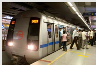
Metro u Delhiju – Faza 2 (Indija)

JICA podržava ubrzanje ekonomskog / društvenog rasta zemalja u razvoju kroz privatni sektor, putem ulaganja u kapital za razvojne projekte privatnih kompanija.