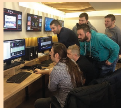
Albansko srpski tim zajedno na razvoju programa

Prošlo je 20 godina od završetka sukoba na Kosovu, ali još uvek postoji potreba za poboljšanjem međuetničkih odnosa. Da bi podstakla saradnju, JICA je podržala kosovsku javnu radio-televiziju, Radio-televiziju Kosova (RTK), u proizvodnji i emitovanju informativnih emisija koje je zajednički producirao multietnički tim. Tim je kreirao informativni program pod nazivom "UMAMI", a naziv je dobio od japanske reči za prijatan ukus. Zasnovan na konceptu međuetničke saradnje, UMAMI je istraživački dokumentarac koji pokriva različite teme iz obe perspektive. Emisija se emituje sa titlovima na albanskom i srpskom jeziku.