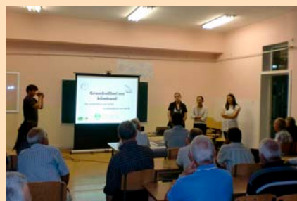
Sastanak u zajednici - uvođenje novog sistema sakupljanja otpada

šanje sistema javnog odlaganja otpada u Prizrenu i nekim opštinama u okolini Prizrena donacijom oko 40 novih kompaktnih kamiona relevantnim komunalnim preduzećima.