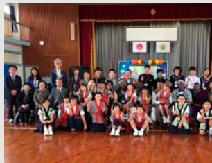
Obuka u Japanu: Razvoj u zajednici sa lokalnim stanovnicima kao glavnim akterima