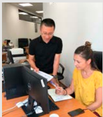
Savetnik za pomoć

Za razvoj ljudskih resursa i formulisanje administrativnih sistema zemalja u razvoju, tehnička saradnja uključuje slanje stručnjaka, obezbeđivanje potrebne opreme i obuku osoblja iz zemalja u razvoju u Japanu i drugim zemljama. Planovi saradnje se mogu prilagoditi širokom spektru pitanja.