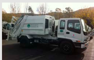
Projekat unapređenja upravljanja čvrstim otpadom

Bespovratna sredstva su finansijska sredstva data zemljama u razvoju koje imaju nizak nivo prihoda, bez obaveze otplate. Bespovratna sredstva koriste se za poboljšanje osnovne infrastrukture kao što su škole, bolnice, vodovodni objekti i putevi, kao i dobijanje zdravstvene i medicinske nege, nabavku opreme i druge zahteve.