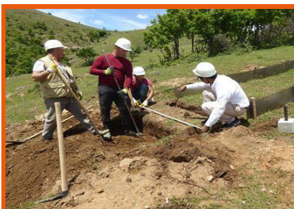
Инсталирање на парцели за надгледување на шуми

JICA ги препозна важноста на оваа институција и нејзиниот придонес во македонската култура. Бесповратните средства за набавка на нови инструменти за симфониски оркестар и звучна опрема ќе бидат комплетирани во 2020 година. Новите инструменти и опрема ќе придонесат за квалитетот на македонската музичка култура, како и за зголемување на настапите во земјата и надвор од неа.