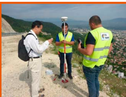
Мерења на терен