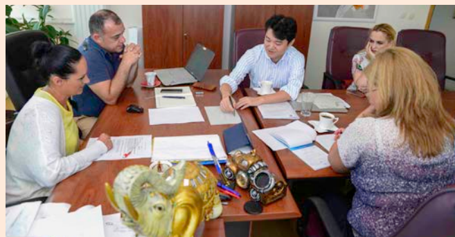
Состанок на менторите