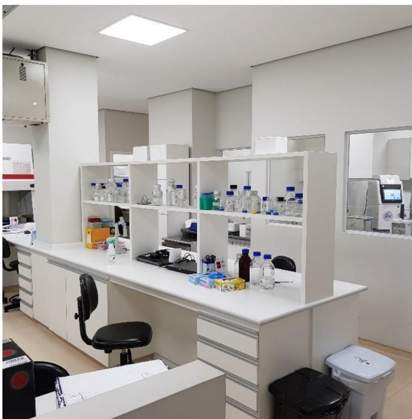
真菌ラボラトリー

医療の世界では、薬剤耐性の真菌感染症が多くなっており有効な治療のためにはこうした真菌感染症診断の研究協力体制の強化が必要となっています。このため千葉大学とカンピーナス大学(UNICAMP)は科学技術協力(SATREPS)「ブラジルと日本の薬剤耐性を含む真菌感染症診断に関する研究とリファレンス協力体制強化プロジェクト(リンク https://www.jica.go.jp/brazil/portuguese/office/activities/brazil02_03.html )」を実施中で、9月18日に真菌ラボラトリーの拡張リニューアル開所式実施の予定です。