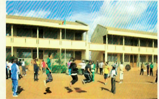
L'école construite par le Don japonais

La JICA a construit plus de 120 écoles (1500 salles) dans toutes les 10 régions du Cameroun à travers les dons . Afin d'améliorer la qualité de l'éducation, la JICA envoie des enseignants volontaires (JOCV) dans des écoles et aussi fournit des formations aux fonctionnaires pour renforcer leurs capacités au Japon ou dans les pays tiers.