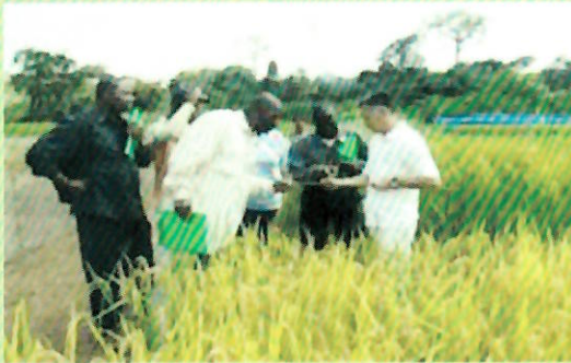
Formation pour la production de NERICA (New Rice for Africa)

Le développement rural est l'un des domaines prioritaires pour la croissance économique et la réduction de la pauvreté au Cameroun. La JICA met en œuvre le Projet de Développement de la Riziculture Irriguée et Pluviale « PRODERIP » (2016-2021) afin d'augmenter la quantité et d'améliorer la qualité du riz produit. Nous invitons aussi les stagiaires au programme de formation sur le développement rural au Japon .