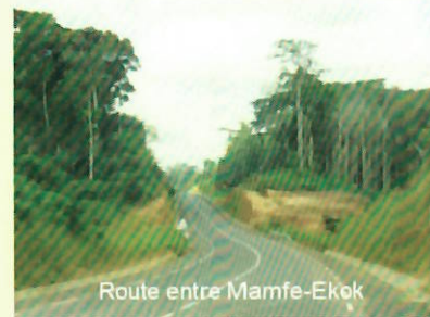
Route entre Mamfe-Ekok