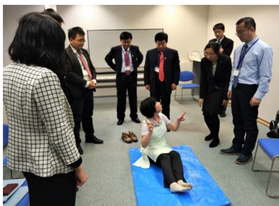
訪日研修で日本の介護福祉士資格研修のミニ 講座を受講