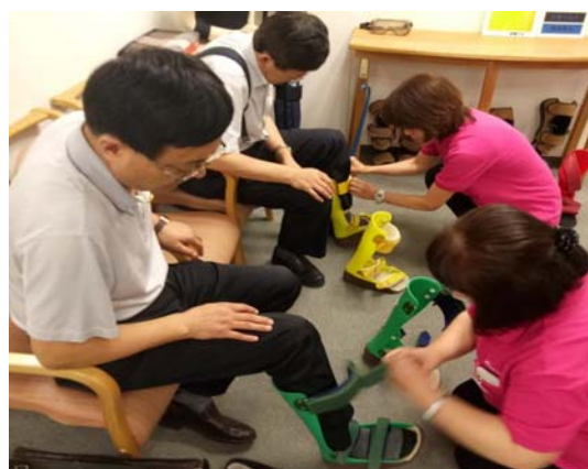
訪日研修で日本の介護用品を試着