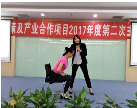
現地国内研修で身体力学を活用した介護技術を 紹介