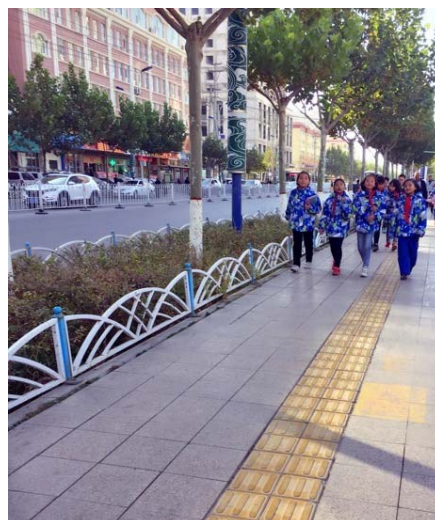
集中熱供給の整備により現地の生態環境が守られています

第三者による事後評価報告書によると、本事業の実施によって、対象 6 都市において、上下水道、集