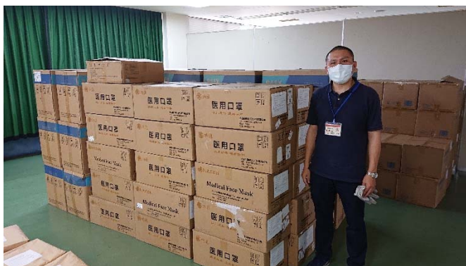
高知県に届けられた救援物資

新型コロナウイルスの日本での拡大が心配された 3 月下旬から 4 月にかけて、おさまりをみせる中国では海外への支援活動が活発に行われていました。このような状況の中、中国計画生育協会から、日本に救援物資を送りたいが、どうしたらいいかと相談を受けました。実は、中