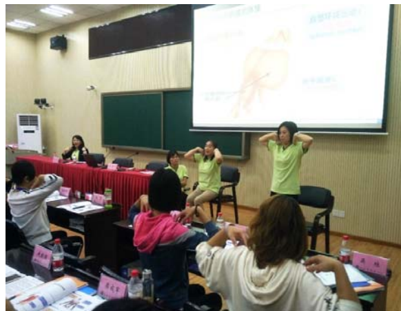
現地国内研修で認知症予防の体操を紹介