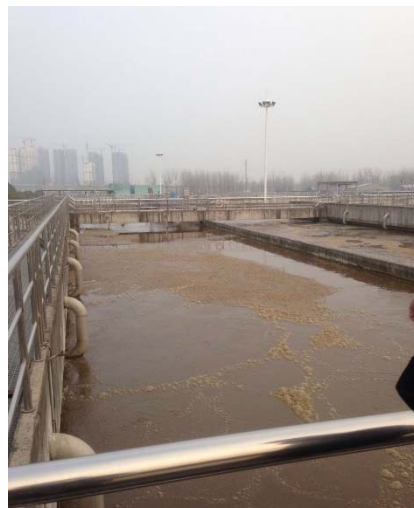
蚌埠市第二污水处理場拡張

2007 年当時、蚌埠市がある淮河流域では、経済の急速な発展による下水量の増大に下水処理能力が追いつかず、淮河の水質汚濁を一層深刻化させる恐れがありました。また、同市では上水普及率が低く、水質の悪い地下水が多く利用されており、さらなる経済発展に伴う給水需要の増加も想定し、水質の良好な河川を水源とする上水道施設の整備が不可欠となっていました。この円借款協力事業（下水道施設及び上水道施設の整備に必要な資機材の調達）の実施による、第三者事後評価専門家報告書の中で、“淮河へ流入する水質汚濁物質の排出量の削減、及び安定的かつ安全な水供給の実現であり、