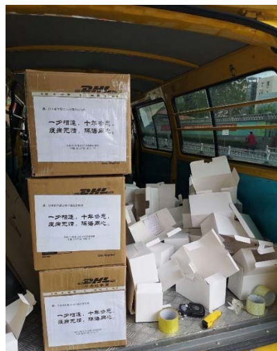
研修員から送られたマスク。箱にメッセージが書かれています

輸送手段が制約され、マスクの輸出規制が始まる中、輸送には相当時間がかかりました。北京の通関を抜け、日本へ直行かとおもいきや、香港経由で名古屋へ、そして福井県へ。十日間以上を経て、マスクは無事に到着しました。福井県日中友好協会からは、当時のホームステイ先にマスクを配布していただき、思わぬ中国からの贈り物にとっても喜んでいただけた、というお礼をいただきました。10 数年の時を超えて、災害の機会に助け合う、素晴らしい隣国関係の 1 シーンだと感じました。