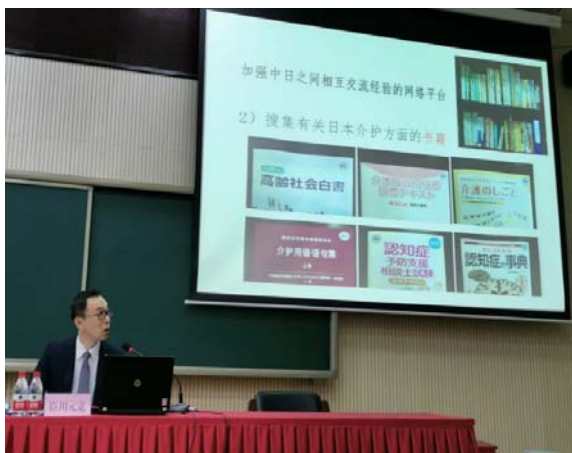
現地国内研修で日本の介護関連書籍を紹介