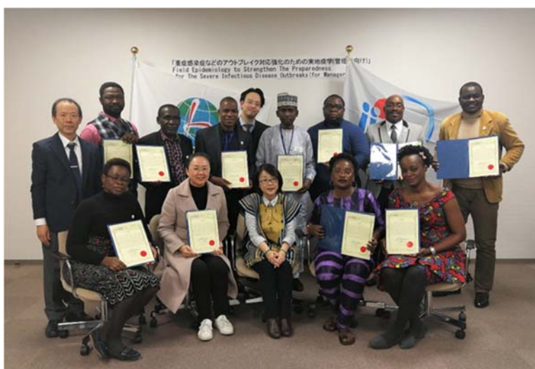
研修を共にうけた仲間たちと

ジア人の私は言葉に自信がなくてストレスを感じていましたが、日本の街を歩いていると、至る所で漢字が見られ、私は意味が理解できますので、アフリカのクラスメートたちと比べると、不自由を感じずに快適に生活を送れたと思います。特に、日本の庶民的な食べ物