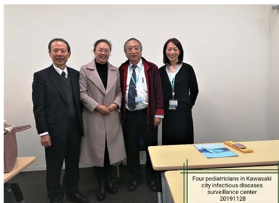
講義してくれた先生たちと

修員たちから、アフリカ諸国におけるワクチンの使い方と感染症の予防・コントロール状況を聞きました。