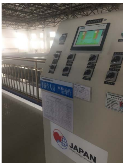
円借款を利用したハミ市第四浄水場建設

集中熱供給、都市ガス供給が整備されたことで、住民の生活水準と環境改善に寄与したことが受益者へのグループインタビューを通じて確認できました。また、自然環境へのインパクトについても適切なモニタリングと環境対策が実施され、負のインパクトは認められないということ