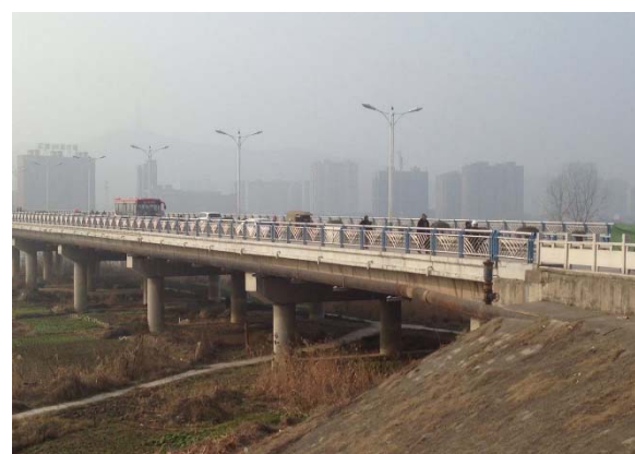
懷遠県上水道建設

住民の生活環境の改善」についても、上下水道が整備されたことで住民の生活環境改善に寄与したことが受益者へのグループインタビューを通じて明らかとなった。加えて、改良飲料水源を継続して利用できる人口の割合、及び改良衛生施設を利用できる人口の割合の指標も大幅に改善している。”と記載されました。