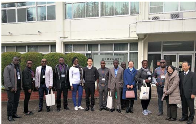
国立感染症研究所にて一週間にわたる研修

日本国立感染症研究所（NIID）で約 1 週間の研修が行われ、その間に研究所の中にある各バイオセーフティーレベル（BLS-1.2.3）の実験室（BLS-4 を除いて）を見学し、ハイレ