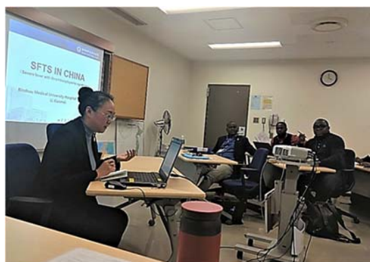
カントリーレポートの発表

日本で 1 ヶ月にわたる JICA 研修に参加して、2019 年 12 月 15 日に無事に終了しました。研修のテーマは、「管理者向けの、重症感染症などのアウトブレイク対応強化のための実