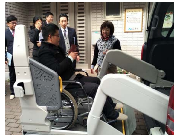
訪日研修で日本の高齢者介護施設を訪問