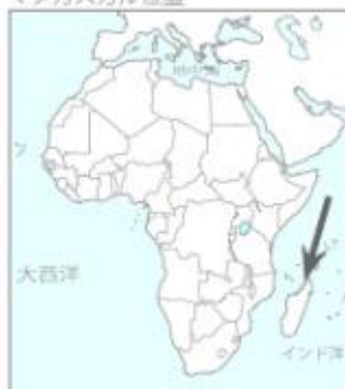
マダガスカル位置