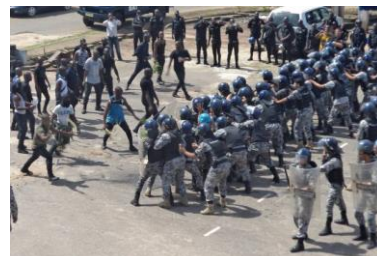
Formation pour renforcement de capacité de la Police Nationale