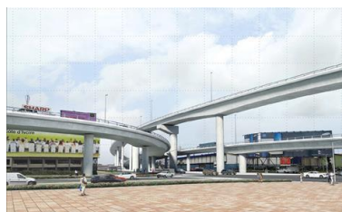
Aménagement de l'Echangeur de l'amitié Ivoir-Japonaise'