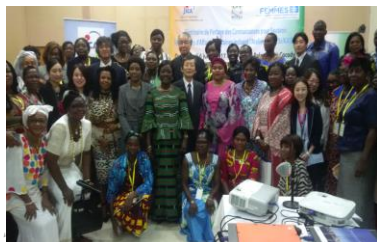
aux femmes d'affaire en juillet 2017