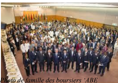
Photo de famille des boursiers 'ABE initiative' à l'arrivée au japon