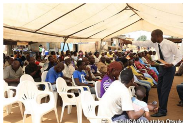
Projet de promotion de la cohésion sociale dans Abobo et Yopougon