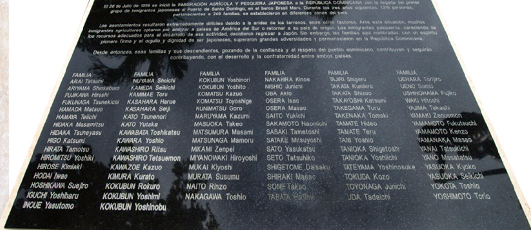
(左) 移住記念碑背面の碑板 (右) 記念碑傍らの碑板・ドミニカの地にとどまり多くの困難に立ち向かった日本人移住者家族名を記載 Tarja en la parte Posterior del Monumento (imagen izquierda). Tarja grabada con nombres de familias japonesas (imagen derecha).