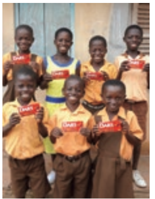
Morinaga & Co., Ltd. verse une partie du produit de ses ventes de chocolat pour soutenir les communautés productrices de cacao en collaboration avec les ONG Plan International et ACE.

D'autres participants ont également fait remarquer que si les entreprises s'efforcent de payer un prix « équitable » aux agriculteurs, les consommateurs ne sont pas disposés à payer plus cher. En comprenant d'où viennent les produits que nous achetons et en faisant des choix éclairés, nous pouvons soutenir ces efforts. Le cacao durable doit être atteint non seulement par les entreprises et les ONG, mais aussi par la société dans son ensemble.