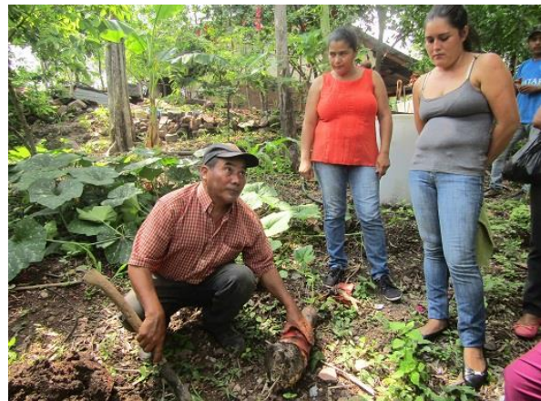
バナナの植え方を指導している事業スタッフ