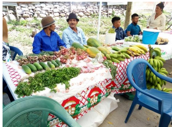
第一回青空マーケットに出された収穫物