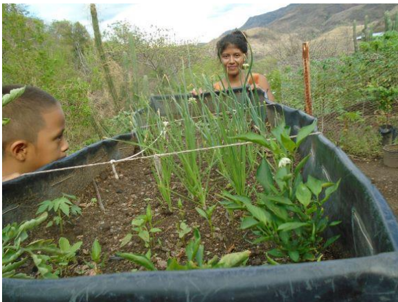
土地がない家庭が工夫して菜園を実施している様子