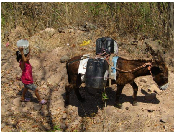
水汲みを手伝っている子供の様子