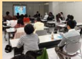
長野市「もんぜんぶら座」での募集説明会