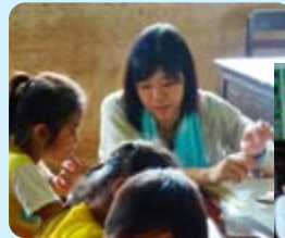
訪問した学校にて

昨年の夏休みに研修としてラオスへ行かせていただきました。海外研修では実際に発展途上国と言われている国へ行けると聞き、「自分の見たことを子供たちに伝えたい」という思いで参加しました。途上国と言われてはいましたが、実際行ってみると、ラオスはたくさんの笑顔や優しさで溢れている国で、人々は皆幸せそうだったことに驚きました。ラオスは日本のように文明的に発展しているわけではありませんが、とても自然が豊かな村でゆったりと過ごしている人