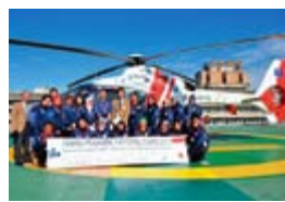
佐久病院屋上のドクターヘリ