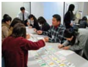
小学校英語教育体験

ました。講座の1つ須坂園芸高校のカンボジア活動報告に参加した高校生からは、「同じ高校生が国際協力を実践していることに刺激を受けた」との感想もありました。