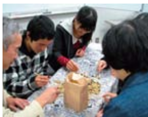
コーヒー豆の選別作業

午後のセッション2では、県内の団体や学校で取り組まれている国際協力、国際交流、多文化共生を各講師が紹介。各講座では、グループディスカッションや体験型ワークショップが実施され