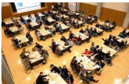
星のステージでのクローージングセッション

今年度も長野県内の市民が国際協力について考える「信州グローバルセミナー2012」が12月9日(日)に駒ヶ根青年海外協力隊訓練所で開催されました。