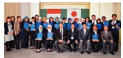
(財)農村保健研修センターでの修了式