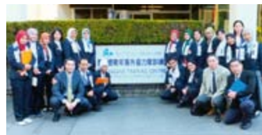
開講式後の記念撮影

青年研修／保健医療実施管理コースのインドネシアからの研修員17名(男性3名、女性14名)が11月1日～18日の日程で研修を実施しました。JICA東京でのプリーフィング後、11月3日にJICA駒ヶ根で開講式を実施。その後は佐久市の(財)農村保健研修センターに宿泊をしながら、合宿形式の集団生活を行いました。研修員は交代で調理班・買い物班等の作業分担を行う事で、研修員同士の結束も深まりました。長野県庁での講義以外は、佐久市・南佐久郡を中心に農村地域の保健医療サービスを重点に学び、夜間も自主的にミーティングを行うなど士気も高く、効果的に研修を修了する事が出来ました。