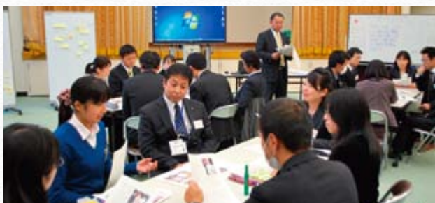
国際理解教育ワークショップ

例年、長野県総合教育センター主催で開催している「高等学校10年経験者研修、地域研修D～国際理解教育～」が、今年度は11月16日(金)に駒ヶ根訓練所で開催されました。当日は15名を対象に、青年海外協力隊や教師海外研修経験者による活動報告、訓練中の候補者との昼食懇談会、所内の施設や語学クラスの見学、国際理解に関するワークショップを体験して頂き、参加者からは、「国際協力の意義や、世界や未来のために、今の自分にできることを考えさせられました」等、より身近に国際協力を体感して頂く機会となりました。今年度はその他にも南信地域の高校初任者研修や、上伊那地域の義務教育の初任者研修等にも訓練所の施設をご活用頂き、研修が実施されました。