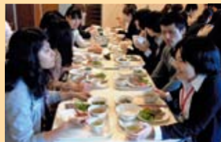
訓練中のボランティア候補者との昼食懇談会

JICAボランティアへの募集、説明等につきましては、募集期間外でも随時受け付けておりますので、駒ヶ根訓練所宛ご連絡ください。