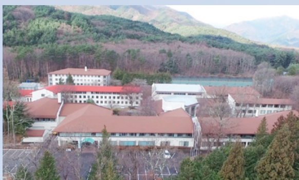
現在の訓練所全景