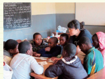
子供たちとの活動の様子