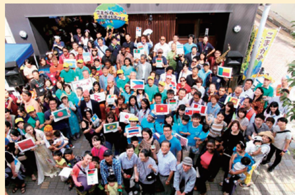
昨年度の集合写真