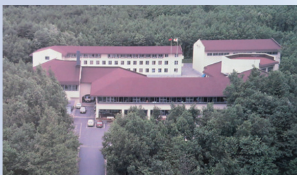
開設当初の全景写真