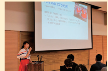
コスタリカ映画上映会にて国紹介

Hola(やあ)! 帰国から1年8ヶ月、私はいま長野県松川町でホストタウン推進員としてコスタリカとの交流事業を担当しています。「ホストタウン」とは、2020年の東京オリンピック・パラリンピックに向けて、参加国と人的・文化的・経済的交流を深める地方自治体のこと。協力隊時代の経験やネットワークを活かして、コスタリカの方を招いての料理体験や柔道交流会の開催、イベントでのコスタリカブース出展、スペイン語教室、出前講座等を行っています。あまり馴染みのない国ですが、「素敵なお所だね」「行ってみたい」と興味を持ってくださる方が増えており嬉しいです。