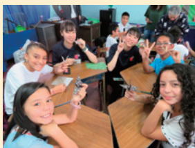
スタディツアー-小学校交流で折り紙

今年3月には町の高校生10名を派遣するコスタリカ・スタディツアーを初めて開催しました。高校生は半年間、訪問先や地元について学