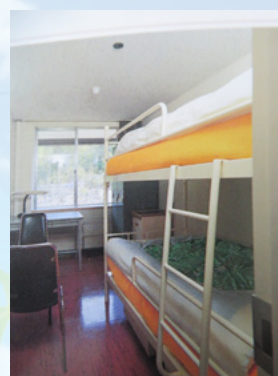
昭和 57 年頃の 2 段ベッドの居室

2006年(平成18年)からは、シニア海外ボランティア(SV)と青年海外協力隊との合同訓練が始まり、2017年から日系社会ボランティアも駒ヶ根に合流するなど訓練生の多様化も進みました。修了者数は累計で2万人を超えています。