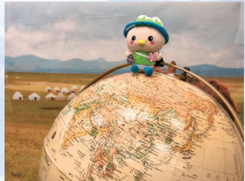
こまかつぱの世界旅行

さらには、40周年記念企画として、駒ヶ根市のPRキャラクター「こまかつぱ」がJICA海外協力隊員とともに世界各地を旅する「こまかつぱの世界旅行」を実施します。世界中で活躍する隊員から送られてくる「旅するこまかつぱ」と派遣国の文化や名所の様子を、JICA駒ヶ根のFacebook等で多くの皆さまにご紹介していきたいと思っておりますので楽しみにしてください。