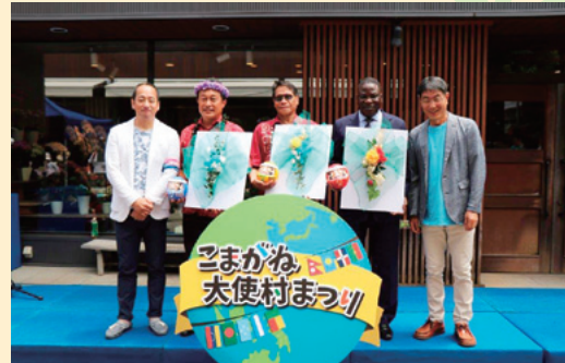
市からのプレゼント

また、10月に恒例の「みなこい国際広場」があり、訓練所開設40周年公式行事も開催されますが、ここにはさらに多くの大使館をご招待する計画です。なお、在住外国人は「地球人ネットワーク」という任意団体が運営している日本語教室に通っている外国人30人ほどを主な対象にしています。「地球人ネットワーク」の皆さまには、訓練の一つ協力活動(地域実践)にも関わっていただいております。訓練所がある街としてその特徴を生かした活動をこれからも続けていきたいと思っています。