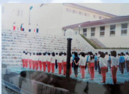
昭和 54 年開設当初の 中庭での朝の集い