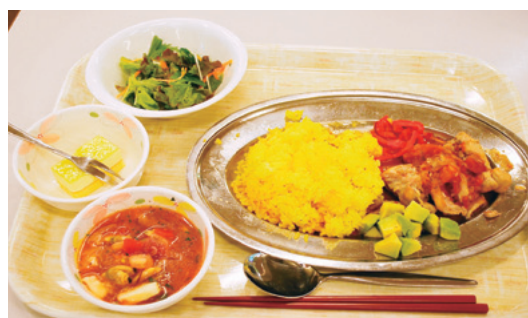
セコ・デ・ポジョ

駒ヶ根訓練所開設40周年の記念イベントの一つとして、駒ヶ根訓練所の食堂でエスニック・ランチを開催しています。