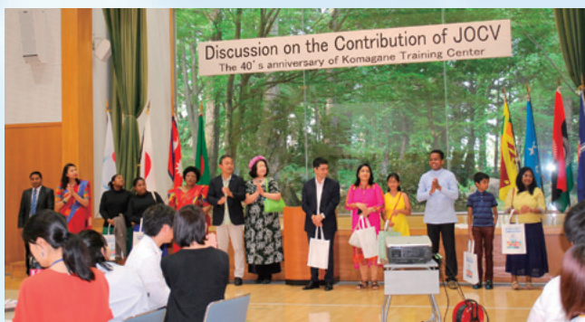
▲お招きした大使・大使館関係者

今回の「大使村まつり・意見交換会」は、駒ヶ根訓練所開設40周年に合わせ、お招きした大使・大使館関係者と訓練生が「協力隊の貢献と未来への期待」をテーマに直接意見交換をしながら、JICAボランティア事業および訓練所について理解を深めていただくために実施しました。