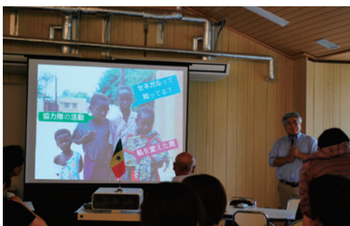
城村さんの体験談