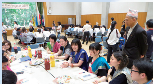
▲ネパールグループ

ネパール、ミクロネシアのグループは、実際にこれから派遣される訓練生たちが集まり、自分たちがこれから派遣される任地のことや、活動に関して、積極的な質疑応