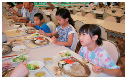
子供たちもおしくいただきました。

次回は、9月21日の予定です。詳しくは、訓練所のHPやFacebookで随時お知らせします。