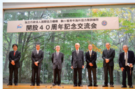
▲7名の歴代の訓練所長さんも駆けつけてくださいました

訓練所長にも駆けつけていただき、お祝いと共に地元との一層の関係構築に期待が述べられました。