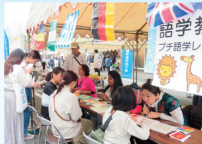
▲大盛況の語学体験

学体験。初めて聞く言葉に驚きながらも、語学講師から楽しく丁寧に教わることで、最後には流暢に話すことができました。