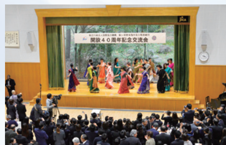
▲交流会でのネパールダンス

最後は、駒ヶ根訓練所を巣立った4ヶ国(セネガル、ネパール、ボリビア、フィジー)の隊員達からの心温まるお祝いのビデオメッセージの紹介と、青年海外協力隊の隊歌「若い力のうた」の合唱で締めくくり、参加者一同で40年を祝うことが出来ました。