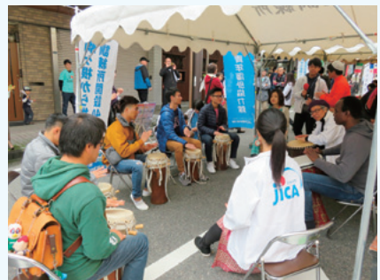
▲アフリカンドラム体験

「知って、見て、やってみる!」をテーマに、駒ヶ根訓練所ならではのブース出展をしました。ご来場いただいた皆さま、ありがとうございました。