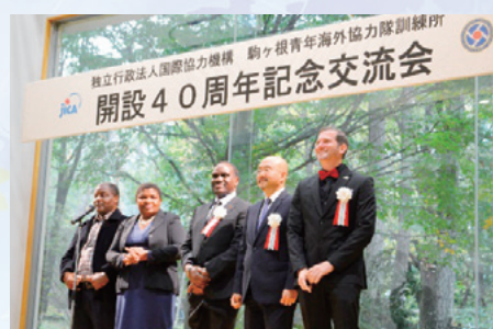
▲ニカラグア、ベネズエラ、マラウイの各国大使

式典後の交流会では、翌日の「みなこいワールド・フェスタ」に参加する3ヶ国(ニカラグア、ベネズエラ、マラウイ)の大使と7名の歴代訓練所長さんも駆けつけてくださいました