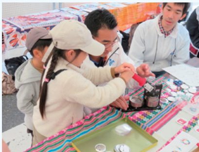
▲缶バッジ作りを楽しむ子どもたち

ブースの中では、子どもたちがSDGsロゴマークの缶バッジづくりに熱中。絵を描いて、形を整え、機械に入れ