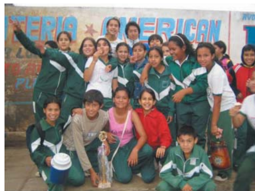
▲市主催のフットサル大会で配属先小学校が優勝

子どもたちの歓声が更に大きく、そしてもっともっと体育が好きになってもらえたらと思っています。