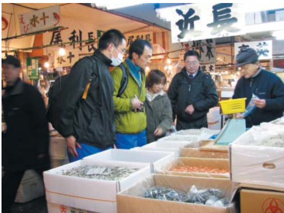
▲信州食農研究会の視察旅行(右から2番目)