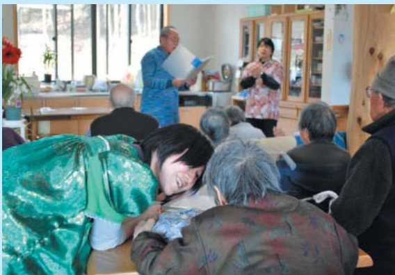
▲利用者の方とふれあうボランティア

「今、途上国で活動している皆さんには、ただ元気で頑張ってもらいたい気持ちでいっぱいです。また駒ヶ根に来ることがあればぜひ私たちの所にも顔を出して欲しい」と途上国で活躍しているボランティアの姿を思い浮かべながら語ってくださいました。