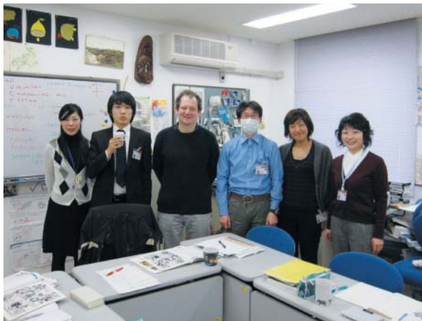
▲英語クラスのみなどと。(一番右端)

私が協力隊に応募したきっかけは、駒ヶ根市役所で担当していた「学校交流」との出会いでした。これは、駒ヶ根訓練所で訓練中のJICAボランティアが地域の小、中学校等へ出かけ、自分の任国、活動について児童生徒とともに学びあうという事業です。