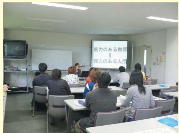
▲一日体験入隊の様子