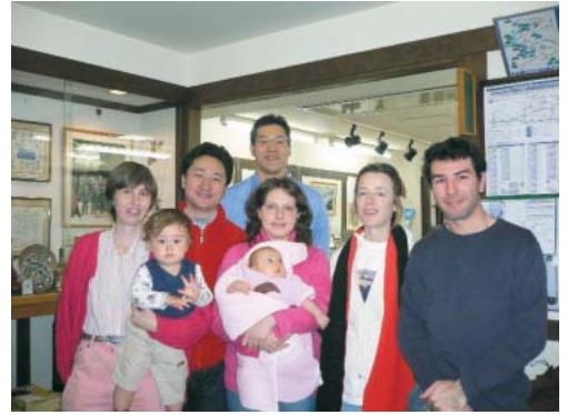
▲私(中央奥)の家族と友人、ホテルフロント前にて

今、いろいろな国の人たちとビジネスで、そしてホテルでお客様と接することがありますが、いろいろな人たちとのコミュニケーション、彼らが初めてのこの地で何を求めているのか等、自分の経験した不安や喜びと置き換えて話ができます。これはあの地での体験があったからこそできるものであり、それが人に与える喜びを大きな物にすることが出来るのです。私のホテルは英語圏の一番大きなホテル口コミサイトで地区一番の評価をもらっています。この地位を維持すべく、そしてこの村を世界有数の山岳リゾートにするべく邁進するのみです。協力隊のネットワークにも今以上に協力していきたいです。