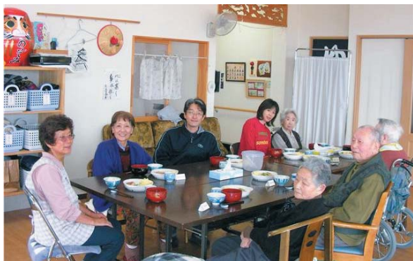
▲お昼は利用者さんと一緒にいただきます！ (左から3人目)

異文化理解を押しさえたら、あとは必要なのは何事へも飛び込んでいく勢いかと思います。東洋の青年が、海とも山とも分からぬ所へ行く事自体「勢い」が無ければ出来ない事かと思いますが、帰国後も決してその精神は錆び付かせていけないと思います。飛び込んでしまえば何とかなること、これは、隊員経験者は良く知っている事です。