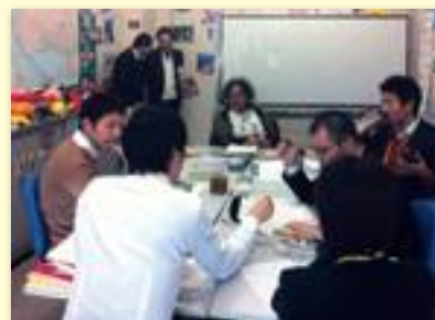
語学研修見学の様子▶ (フランス語)

このように、世界を舞台に活躍できる人材として注目されてきているJICAボランティアを、駒ヶ根訓練所も積極的に、継続的に支援していきます。