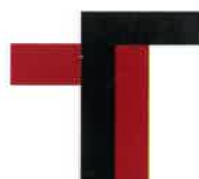
豊橋技術 科学大学