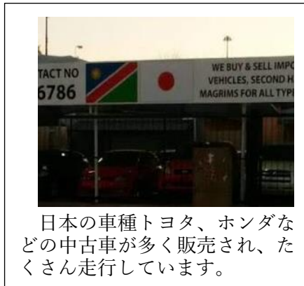
日本の車種トヨタ、ホンダなどの中古車が多く販売され、たくさん走行しています。