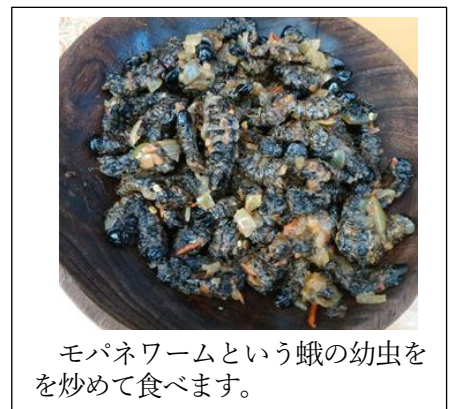
モパネワームという蛾の幼虫を炒めて食べます。

※ もしも何か知りたいことがあれば、先生に言ってください。答えられる範囲で次回お伝えしたいと思います。