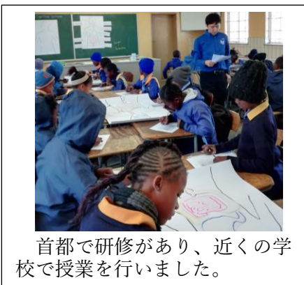
首都で研修があり、近くの学校で授業を行いました。