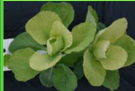
Escasez de Fe