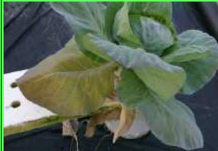
Escasez de Mn