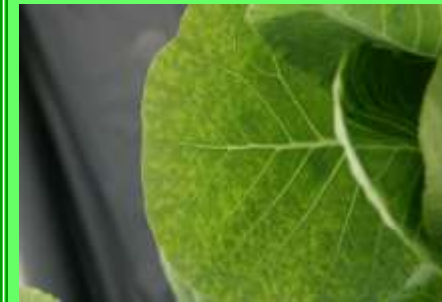
Escasez de Cu