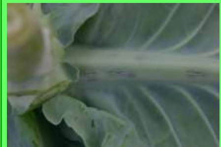
Escasez de B