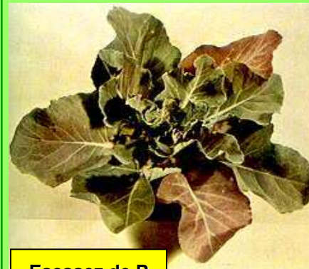
Escasez de P