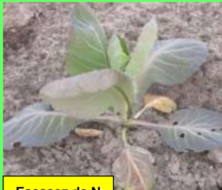
Escasez de N