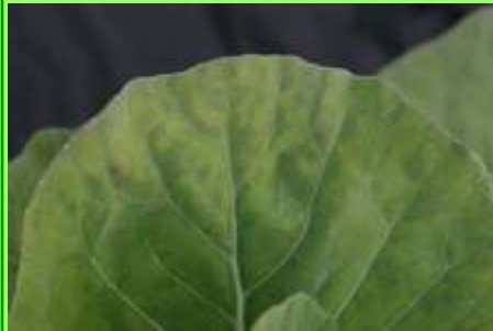
Escasez de Mg