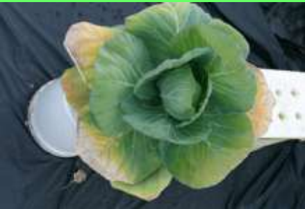
Escasez de K