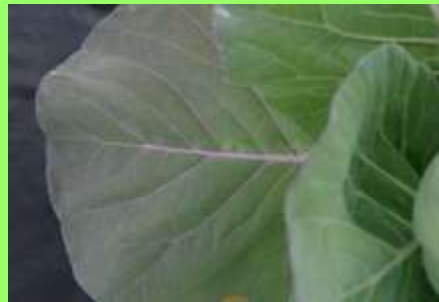
Escasez de Zn