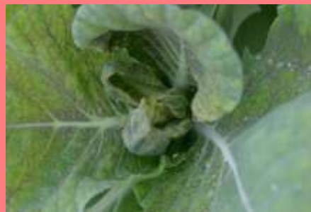
Escasez de Ca