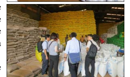
Photo du haut : centre de tri de sésame d'une capacité de 100t/jour du Groupe VELEGDA SARL, l'un des principaux exportateurs céréalières. Photo du bas : experts japonais visitant un entrepôt du groupe en question.