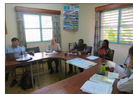
Photo du haut : entretiens avec le Directeur Provincial de du Mouhoun et des personnes concernées par le Projet de la région de la BM. Photo du bas : rencontre avec des membres des associations régionales des producteurs de sésame dans la région de la BM.