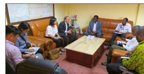
Photo : entrevue entre le Secrétaire Général et les experts japonais.

En outre, des entretiens ont été organisés avec les acteurs impliqués de la production à la distribution, la vente et l'exportation du sésame, et des efforts ont été entrepris pour collecter activement des informations.