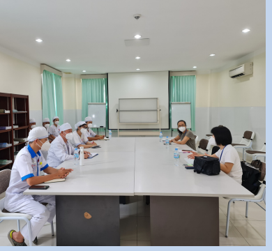
Nursing Skills Assessment, Calmette Hospital / 7th April