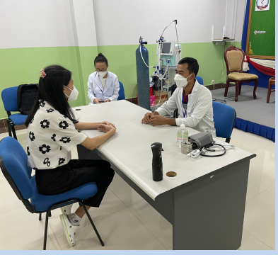
Nursing Skills Assessment, CCPKH / 6th April