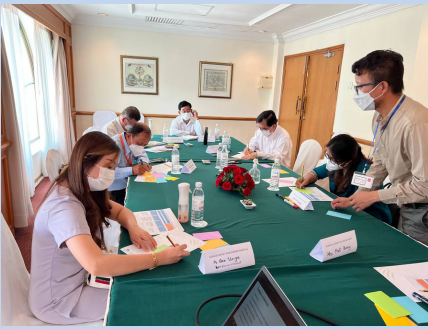
FGD, SUNWAY Hotel / 8th April