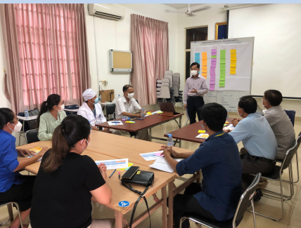
FGD, Kampong Cham Provincial Hospital / 25th April