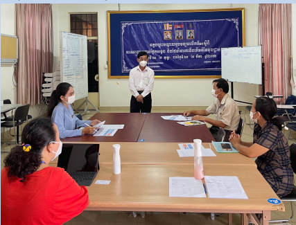
Conduct an Interview at Kampong Cham Provincial Hospital / 26th April