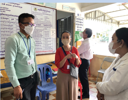
Visiting Ampil Health Center, Kampong Cham Province / 26th April