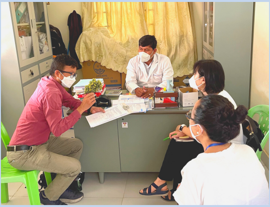
Interviewing & Visiting Prey Sor Health Center / 6th April

ក្រុមការងារគម្រោងបានធ្វើការចុះទស្សនៈកិច្ច ជួបសម្ភាសន៍ ធ្វើកិច្ចប្រជុំពិភាក្សាជាក្រុម និងមានការប្រុងប្រយ័ត្នសម្រាប់ស្ទង់មតិការប្រព្រឹត្តិការណ៍អេឡិចត្រូនិច នៅរាជធានីភ្នំពេញ និងខេត្តកំពង់ចាម ដើម្បីបង្កើនការយល់ដឹងឲ្យបានកាន់តែស៊ីជម្រៅស្តីអំពីសកម្មភាពនៃការថែទាំ និងតម្រូវការបន្ថែម នៃគ្រូបណ្តុះបណ្តាលក្នុងពេលបម្រើការងារ ដែលត្រូវការចាំបាច់នៅមន្ទីរពេទ្យជាតិនិងក្នុងមណ្ឌលសុខភាព។ លើសពីនេះ ក្រុមការងារគម្រោង ក៏បានធ្វើការចុះវាយតម្លៃជំនាញនៃការថែទាំរបស់គិលានុបដ្ឋាក ដើម្បីធ្វើការប៉ានប្រមាណជំនាញនៃការថែទាំរបស់គិលានុបដ្ឋាកនាពេលបច្ចុប្បន្ន នៅក្នុងប្រទេសកម្ពុជាផងដែរ។