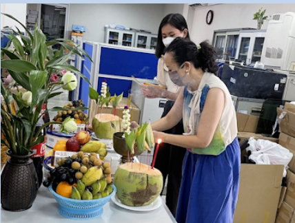
Khmer New Year Celebration at HRDD / 14th to 16th April