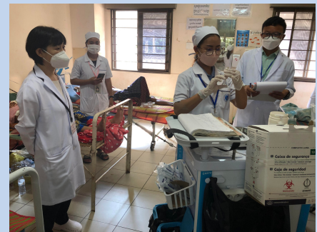
Nursing Skill Assessment, Kampong Cham Provincial Hospital / 26th April