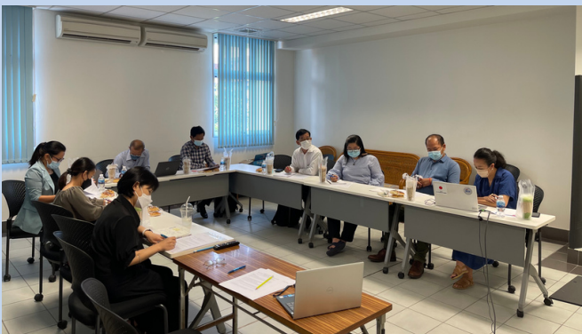
Study Session 4, NMCHC