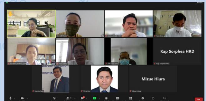
The 3rd Study Session, via Zoom Online Meeting