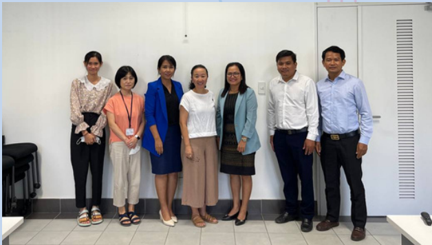
Project Team with some participants of the study sessions

វគ្គបណ្តុះបណ្តាលត្រូវបានរៀបចំឡើងចំនួន ៦ ដង ដើម្បីបង្កើនចំណេះដឹងដែលចាំបាច់ក្នុងការអភិវឌ្ឍគោលការណ៍ណែនាំនៃការបណ្តុះបណ្តាលក្នុងពេលបម្រើការងារ នៅចន្លោះខែមិថុនា និងខែកក្កដា ឆ្នាំ ២០២២។ ក្នុងខែនេះផងដែរ យើងបានធ្វើវគ្គបណ្តុះបណ្តាលបានសម្រេចចំនួន ៣ លើក ជាមួយសមាជិករបស់ក្រុមការងារបច្ចេកទេស។