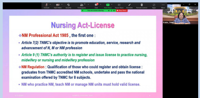
Presented recorded lecture