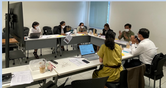
Study Session 5, NMCHC

On 21st July, the 5th study session was conducted to discuss the current situation of continuing education in Cambodia and issues in continuing education and efforts to solve them.