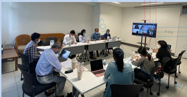
Study Session 4, NMCHC