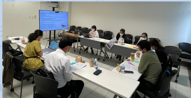
Study Session 5, NMCHC

នៅថ្ងៃទី ២១ ខែកក្កដា វគ្គបណ្តុះបណ្តាលលើកទី ៥ ត្រូវបានធ្វើឡើងដើម្បីពិភាក្សាអំពីស្ថានភាពបច្ចុប្បន្ន នៃការបណ្តុះបណ្តាលបន្តនៅកម្ពុជា និងបញ្ហាក្នុងការបណ្តុះបណ្តាលបន្ត និងការខិតខំប្រឹងប្រែងដើម្បីរកដំណោះស្រាយ។