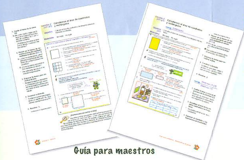
Guía para maestros

➤ Elaboración y Revisión de la Guía del Maestro y el Cuaderno de Trabajo en la Educación Básica