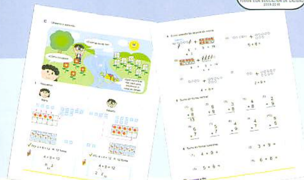
Cuaderno de Trabajo para Niños (as)