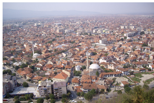
Qyteti i Prizrenit

Ministria e Mjedisit dhe Planifikimit Hapësinor(MMPH),Komuna e Prizrenit dhe EkoRegjioni kanë inicuar Projektin për Ngritjen e Kapaciteteve në Menagjimin e Mbeturinave drejtë një Shoqërie të Shëndoshë ("Projekti") në bashkëpunim me Agjensionin Japonez për Bashkëpunim Ndërkombëtar (JICA) në Komunën e Prizrenit që në Gusht 2011.Projekti do të implementohet deri në Gusht 2014. Ky është buletini jonë i parë dhe me këtë paraqesim sfondin e projektit si dhe aktivitetet.