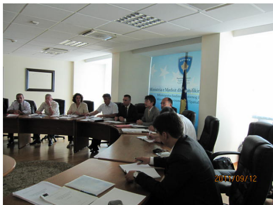
Takimi I pare I KPK-së me 12 Shtator 2011