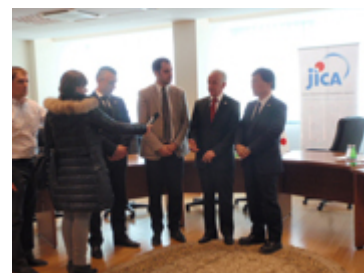
Pamje nga P/D në Prishtinë me 26 Janar 2011,menjëherë pas ceremonies së nënshkrimit ( http://www.jica.go.jp/balkan/office/informati on/event/110208.html )

Qeveria e Kosovës ka formuluar strategji për Menagjimin e Mbeturinave për periudhën 10 vjeqare (2010-2020) si politika zhvillimore për Menagjimin e Mbeturinave të Ngurta.Strategjia përmend arritjet e pakësimit të ndotjes mjedisore të shkaktuar nga mbeturinat,përmirsimin e shërbimit të grumbullimit në tërë vendin, realizimin e një cikli material të shëndoshë përmes 3R (ripërdorimit dhe reciklimit të Mbeturinave).Në përputhje me strategjitë,Kosova ka kërkuar një projekt të grantit ndihmës si dhe projektin e bashkëpunimit teknik " Projektin për Ngritjen e Kapaciteteve në Menagjimin e Mbeturinave drejtë një Shoqërie të Shëndoshë " nga Qeveria e Japonisë.Pas kësaj,JICA ka studiuar atë që duhet të bëhet në Projekt (Komponentët e Projektit),si dhe relevancën e implementimit të Projektit në Dhjetor 2010.Përmbajtja e Projektit ka marrë pajtimin e MMPH dhe është nënshkruar Procesverbal i Diskutimeve (P/D) me 26 Janar 2011. Pastaj nënshkrimi I Projektit është bërë në Gusht.