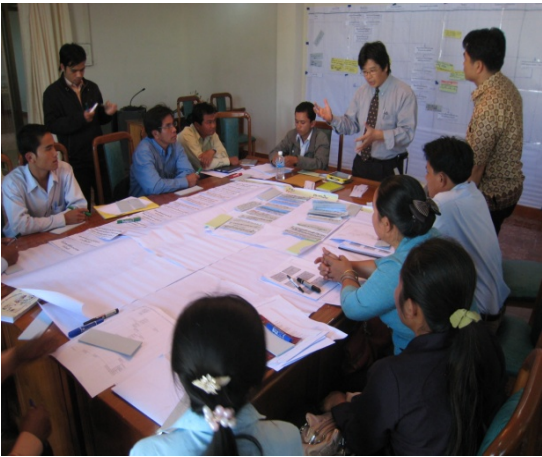
Workshop in Saravane province

ບັນດາເຄື່ອງມື ທີ່ໄດ້ພັດທະນາຂຶ້ນ ໂດຍການຮ່ວມມື ກັບສະມາຊິກພະນັກງານ ຄູ່ຮ່ວມງານ ຈາກ ພະແນກ ການຮ່ວມມືສາກົນ (DIC) ແລະ ພະແນກ ປະເມີນຜົນ (DOE) ແລະ ພະແນກ ແຜນການ (DOP) ຂອງ MPI ຕາມຂັ້ນຕອນດັ່ງນີ້: 1) ການວິເຄາະບັນຫາ ແລະ ທຳຄວາມ ເຂົ້າໃຈເຊິ່ງກັນ ແລະ ກັນ ລະຫວ່າງ ບັນດາຜູ້ກ່ຽວຂ້ອງ; 2) ການສຳຫຼວດ ສະພາບການ ເພີ່ມເຕີມ; 3) ສ້າງໂຄງສ້າງ ສະຖານະການປັດຈຸບັນ ແລະ ກຳນົດບັນຫາ; 4) ການວິເຄາະ ສະຖານະການ ພາຍນອກ; 5) ການປັບປຸງຂັ້ນຕອນ ວຽກງານ;