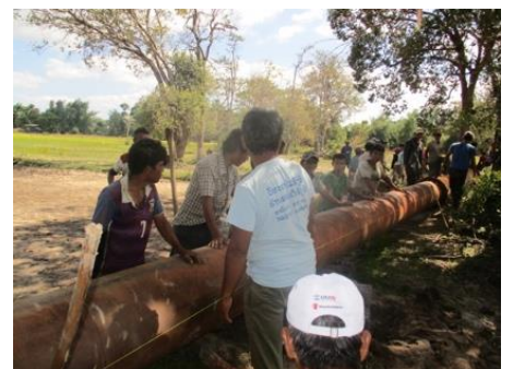
ຊາວນາກຳລັງພ້ອມກັນຕິດຕັ້ງທໍ່ສົ່ງນໍ້າ

ໃນປະຈຸບັນນີ້ໂຄງການກຳລັງເກັບກຳ ແລະ ສັງລວມຂໍ້ມູນຂອງກິດຈະກຳການເຮັດນາແຊງຂອງປີ 2018/2019. ມາຮອດປະຈຸບັນນີ້, ເຫັນວ່າມີຜົນດີຫຼາຍຢ່າງປາກົດຂຶ້ນເຊັ່ນ: ບາງຄົນໄດ້ເວົ້າວ່າ “ເນື້ອທີ່ໃນການຈ່າຍນໍ້າທັງໝົດໃນ 7 ໂຄງການໄດ້ເພີ່ມຂຶ້ນ 1,4 ເທົ່າ ເມື່ອສົມທຽບກັບປີກ່ອນ ຜົນຜະລິດເຂົ້າໄດ້ເພີ່ມຂຶ້ນ”. ບາງໂຄງການກໍໄດ້ເກັບເງິນ ແລະ ຈ່າຍຄ່ານໍາໃຊ້ນໍ້າໄດ້ໝົດແລ້ວ. ລາຍລະອຽດຈະລາຍງານໃນສະບັບຕໍ່ໄປ.