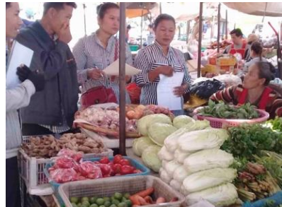
ການສໍາລວດຕະຫຼາດໂດຍຊາວນາ

• ສຶກສາອົບຮົມເພື່ອປ່ຽນແນວຄວາມຄິດຂອງຊາວນາຫັນມາປູກພືດໃຫ້ຖືກກັບຄວາມຕ້ອງການຂອງຕະຫຼາດ. • ແນະນໍາໃຫ້ຊາວນາເຂົ້າໃຈແນວໂນ້ມການປ່ຽນແປງຂອງຕະຫຼາດ ແລະ ຊື້ນໍາການວາງແຜນການຜະລິດ ແລະ ແຜນລາຍຮັບ-ລາຍຈ່າຍ.