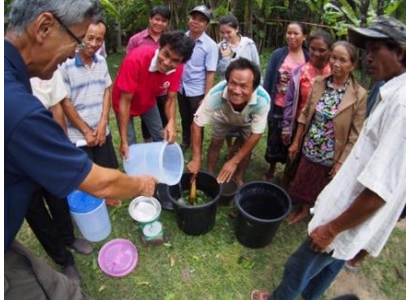
ຝຶກອົບຮົມການເຮັດນໍ້າສະໝຸນໄພໄລ່ແມງໄມ້

• ຊື້ນໍ້າຊາວນາໃນການແກ້ໄຂບັນຫາເຊັ່ນ: ການໃສ່ປຸຍຫຼາຍໂພດ ຫຼື ນ້ອຍໂພດ, ການນໍາໃຊ້ຢາກຳຈັດສັດຕູພືດບໍ່ຖືກວິທີ, ການບົວລະບັດຮັກສາບໍ່ທົ່ວເຖິງຕໍ່ຄວາມເສຍຫາຍຈາກການທໍາລາຍຂອງແມງໄມ້, ຄຸນນະພາບ ຫຼື ຜົນຜະລິດຫຼຸດລົງຍ້ອນເຕັກນິກການຜະລິດຍັງອ່ອນ.