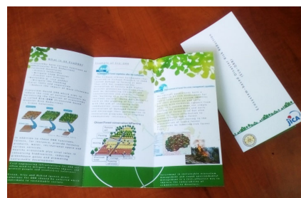
セミナーで配布したリーフレット