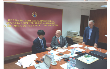
上：質疑応答の様子