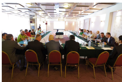
スコピエ市におけるセミナー

最後に参加者からはプロジェクトの活動を理解することができたと共に、防災・減災への貢献が期待されるといったコメントを頂きました。