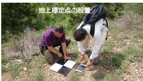
地上標定点の設置