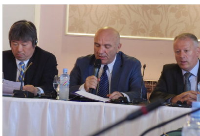
議長による開会の挨拶