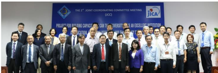
第2回合同調整委員会(2 nd JCC) (13/Dec/2018, @CTU)

Project HP: https://www.jica.go.jp/project/english/vietnam/039