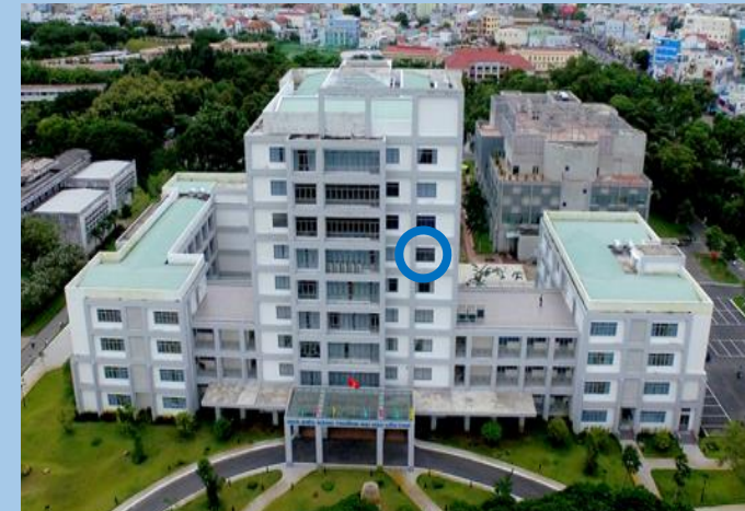
○ プロジェクトオフィス

(円借款) カントー大学強化事業 [Can Tho University Improvement Project] 2015年～2022年(7年間)