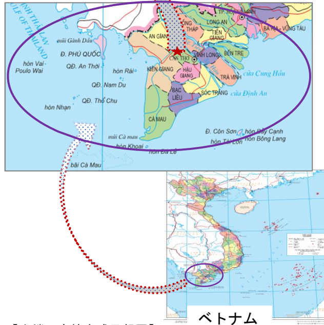
【先端研究棟完成予想図】