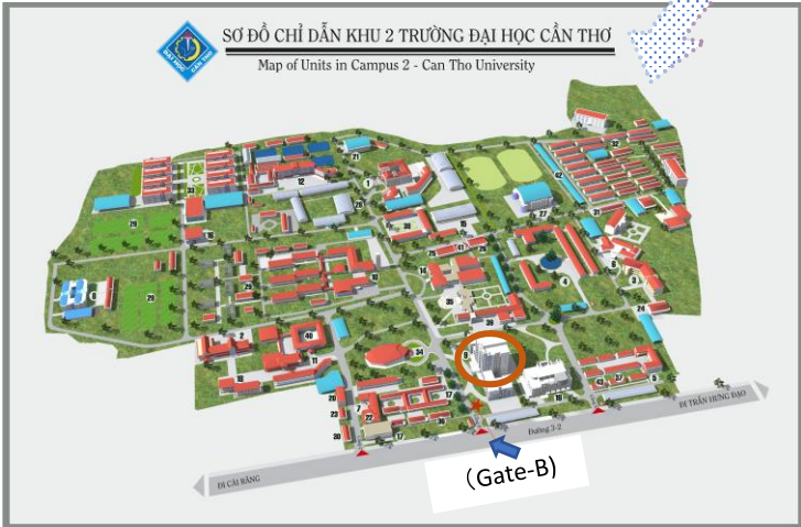
カントー大学 (キャンパス II)