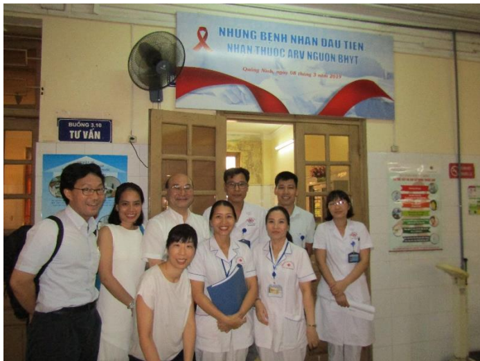
クアンニン省総合病院の皆さんと

訪れた病院はハノイ市内にある Dong Da 病院、09 病院、Nam Tu Liem 医療センター、そしてクアンニン省にあるクアンニン省総合病院の4つです。ベトナムにおける病院システムはピラミッド型になっており、医療保険加入者はそれぞれの住所により指定された医療機関において治療を受けることで初めて保険が適用されます。どのレベルの病院が登録機関として指定されているかは個々人で違いますが、中央レベル病院から省・市病院へ、省・市病院から区・県の医療施設へと、保険医療を求めて患者が移動することが予想されます。