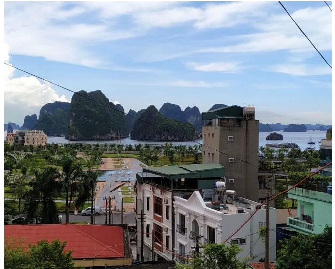
クアンニン省病院は高台にあり、病院からハロン湾の景色が見えてなかなか風光明媚♪

今回各病院を訪問しながら、プロジェクトで導入を予定している HIV/AIDS 治療に関する HIV 情報ネットワークのデモ版を共有、その使用方法や現場での課題について意見交換を行いました。また、2019 年 3 月から始まった医療保険適用後の、地方病院における治療の現状、患者の動きについても最新の状況を聴取しました。ドナープロジェクト支援の終了に向けた動き、患者の保険加入・利用率など、各病院においても過渡期ならではの課題が見え隠れします。