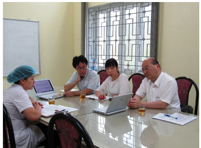
Nam Tu Liem 医療センター医師との意見交換