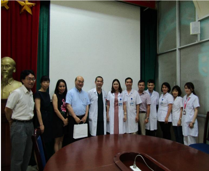
ハノイ市 Dong Da 病院の皆さんと

プロジェクトのメインカウンターパートである国立熱帯病病院(NHTD)は中央レベルの病院であるのに対し、これら4病院はハノイ市・クアンニン省、或いは Nam Tu Liem 区といった地方行政レベルでの病院であり、今後医療保険システムに移行する HIV 治療において、より大きな役割を果たすことが見込まれます。