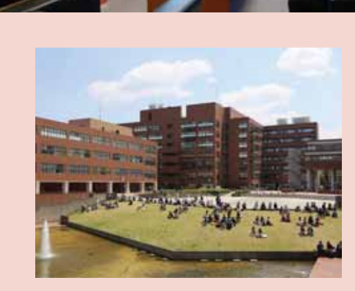
Đại học Tsukuba, trường đại học điều phối chương trình Thạc sĩ Chính sách công của VJU, nằm trong Top 10 trường đại học danh tiếng nhất Nhật Bản.