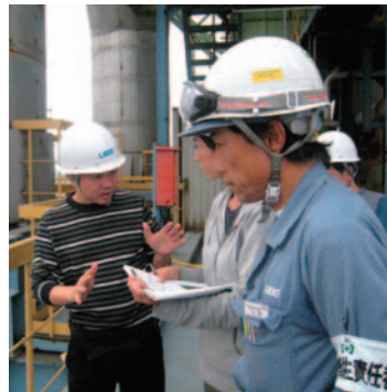
宇部興産株式会社の宇部セメント工場。ごみ焼却灰、下水汚泥などのリサイクルについて学んだ

産官学民が一体となって取り組むまちづくり。地元の人々によってはぐくまれた“宇部方式”の理念と精神が、海を越えて、途上国に広まりつつある。