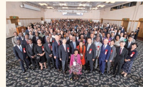
ABEイニシアティブ研修生の歓迎会