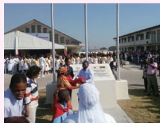
2017年6月に執り行われた、日本が建設を支援したマプト市医療従事者養成学校の開所式

昨年、日本とモザンビークは外交関係樹立40周年を迎えました。この記念の1年間は、3月にニュシ大統領が日本を訪問したことに始まり、8月にはアフリカ開発会議(TICAD)の閣僚会合がモザンビークで開催されるなど、過去40年間の両国の関係においても非常に充実した1年であったといえます。