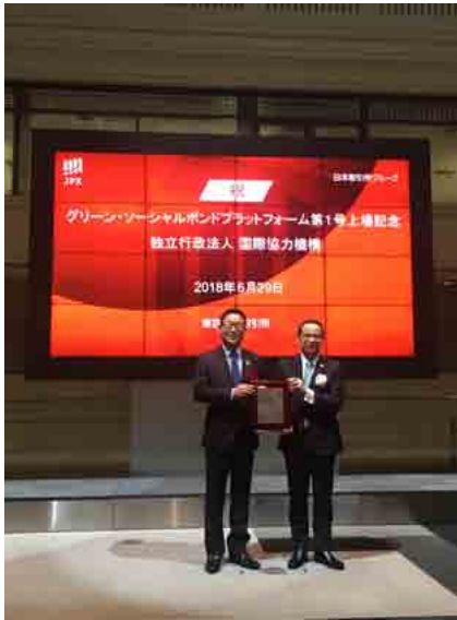
TOKYO PRO-BOND Market上場記念盾の贈呈の様子