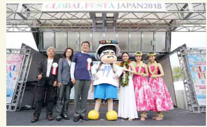
グローバルフェスタ JAPAN2018 の開会式にも登場。