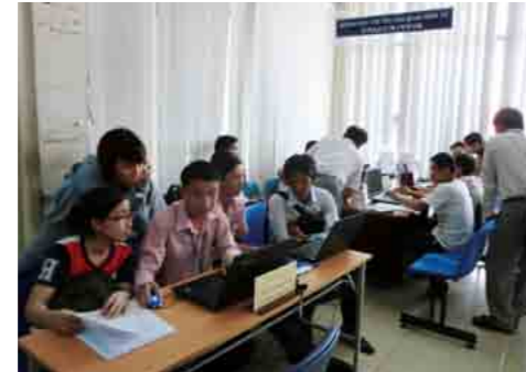
日本の電子通関システムを使用した、ベトナムの通関業者による申告の様子。