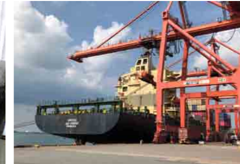
カンボジア発展のシンボルともいえるシハマークビル港。