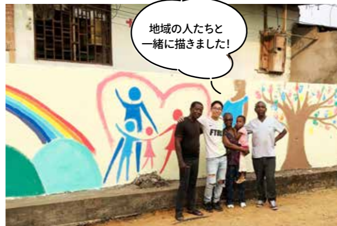
診療所の建物に壁画を制作。住民に親しみや安心感をもってもらうことができた。

人以上増えるといううれしい変化がありました。こうした活動を続けた結果、母子手帳においては約2700部を地域の母親に配付することができました。母子手帳を手にしたお母さんを病院で見ると、協力隊としてカメルーンに来た意義を実感。コロナ禍下で予定よりも帰国が早まりましたが、いままも現地の人たちの力だけで母子手帳の普及活動が継続されています。地域の人たちのために一生懸命取り組んできたことが、彼らの心に伝わったのだと感じています。