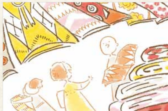
イラスト ● さかがわ成美

カメルーンに行く機会があれば、生地屋でお気に入りの布探しをしてみたいかでしょうか。そして仕立て屋で好きなデザインの衣服を作り、カメルーン流のおしゃれをぜひ楽しんでください! (野地祐輔)