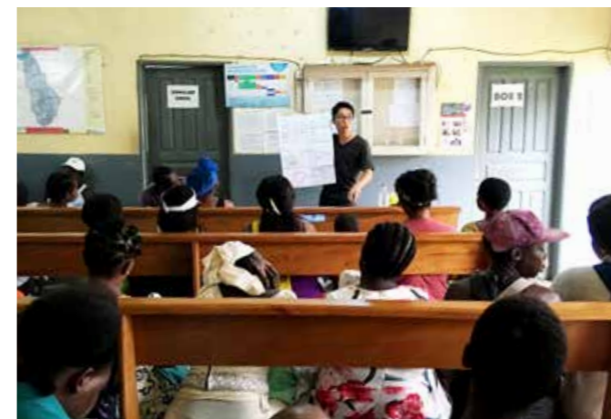
病院に来たお母さんを対象に、母子手帳を活用した健康に関する啓発を行った。

日本から遠く離れたアフリカの姿を自分の目で確かめたいと思いついて、協力量隊に応募しました。赴任先であるカメルーンのエデア市では母子手帳の普及を目指し、母子の病気の予防や健康増進に関する活動を行いました。現地ではマラリアなどの感染症や不衛生な環境下での下痢をはじめ、子どもの死因とな