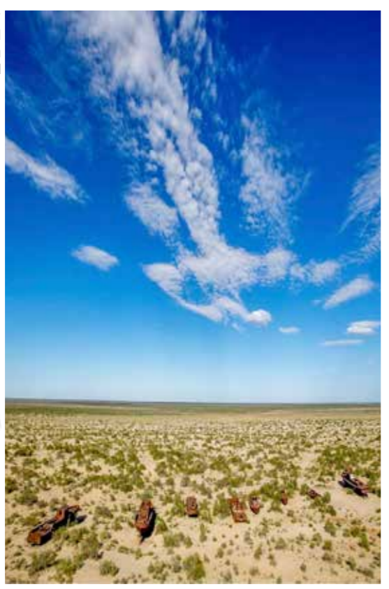
水が干上がって砂漠化したアラル海。

は、旧ソ連時代の化学工場の廃液流出による河川の水銀被害が起きているカザフスタンに対し、技術協力による環境モニタリングを行っています。「21世紀最大の環境問題」といわれるアラル海の砂漠化とそれによる塩害が起きているウズベキスタンでは、国際機関と連携して保健サービスの改善や貧困改善対策などを行っています。アフガニスタンと国境を接する中央アジア地域の国に対し、国際機関と連携して国境管理強化や麻薬対策などの地域協力もを行っています。 このように国と地域、それぞれに必要なとされている協力を行うことで、日本と中央アジア・コーカサス地域のつながりを強くすることができます。