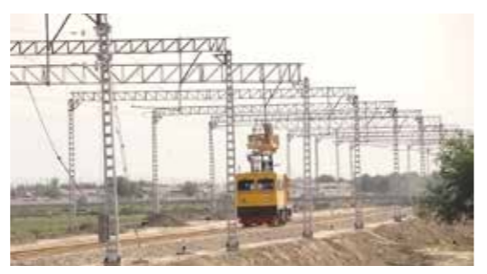
ウズベキスタンでの「カルシ-テルメス鉄道電化事業」では、従来のディーゼル方式よりも牽引力の高い電気方式への改良にJICAが協力。急勾配の山岳地帯を走る鉄道の輸送能力の向上に協力した。