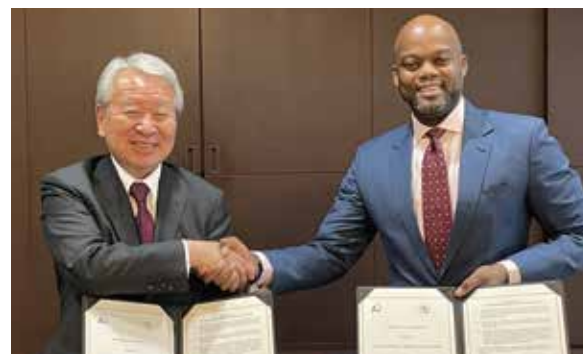
田中理事長とメネAfCFTA事務局長。 アフリカ大陸自由貿易圏協定の実施を促進するために、バリューチェーン構築や貿易円滑化等の分野での連携を進めるとともに、ASEANの経済統合の経験を共有します。