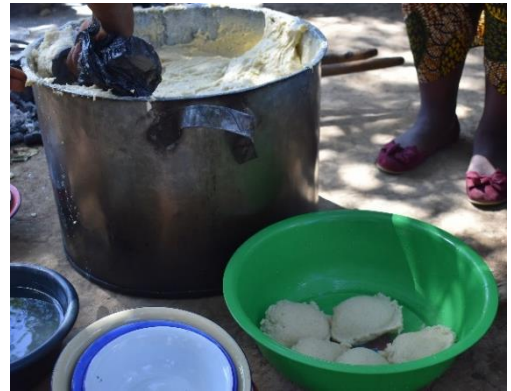
▲ザンビア人の主食「シマ」。トウモロコシを挽いた粉を湯で練り固めてつくる。

（出典：中島みゆき（2013.8）「アフリカ「10 億人市場」の素顔③-「自律」の条件」『メッセージ@pen』、綱町三田会倶楽部）