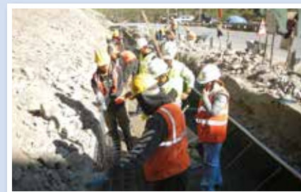
● 道路斜面災害対策技術及び工法に関する普及・実証・ビジネス化事業 (株式会社プロテックエンジニアリング・ブータン)