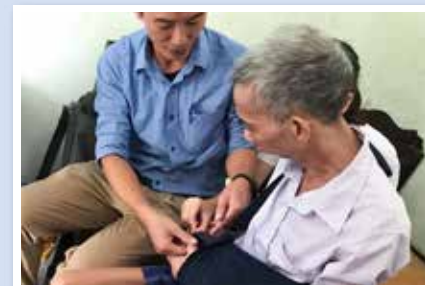
● ハイズオン市の市民に対する地域連携訪問サービスのモデルづくり事業 (新潟医療福祉大学・ベトナム)