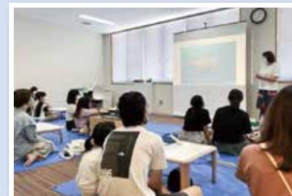
● 新潟市子ども創造センターでのJICA海外協力隊経験者による講話の様子