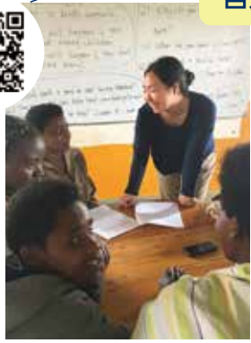
新潟出身のJICA海外協力隊の活動風景 (ルワンダ・コミュニティ開発)