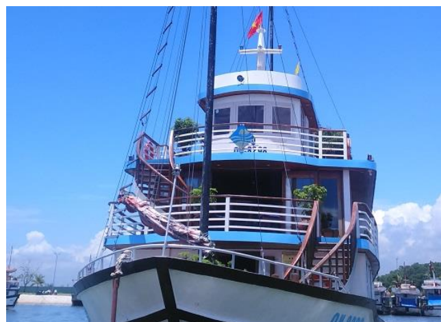
JICA 事業を通して環境認証を受けた観光船 (JICA 技術協力事業を通じ、29 の環境基準を満たす観光船に付与する「ブルーセイル認証」を策定。)

同事業による水質改善や法制度・体制作りの取組に加え、2017 年にはハロン湾・カットバ島沿岸水域を管轄するクアンニン省と滋賀県の間で、環境・経済分野の協力に関する覚書が締結されており、引続きベトナムの水質改善に向けた協力が期待されます。