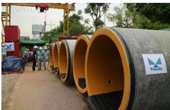
特殊コーティングが施された直径約1.5mの下水管（推進管）

6月25日、JICAの支援する「ハノイ市エンサ下水道整備事業」の管渠パッケージのうち、パッケージ