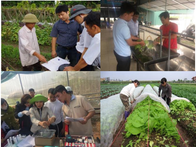
圃場での安全作物栽培の様子

生産活動においては、一般農家が実践しやすい農業生産工程管理として 2013 年に JICA が開発し提唱した技術ガイダンス「Basic GAP」を導入し、圃場* 2 での記帳ガイダンスや内部監査実施支援を行いました。生産者グループの記帳に基づく安全野菜生産面積はプロジェクト開始当初（2016 年）の冬作時点で 50ha 程度でしたが、その後対象グループも増え、2020-2021 年冬作には 188ha まで拡大しました。関係者からは、「記帳の習慣化は、生産工程記録が出来ることに加え、翌シーズンの生産計画の参考にもなる」、「メンバー農家の相互利益を目的として、安全野菜栽培地の確保、顧客維持にかかるグループ内で情報共有が行われるようになった」等の声が報告されました。加えて、プロジェクトでは有機堆肥づくり、土壌消毒技術、育苗技術等の技術指導により、栽培技術の向上と農産物の品質向上に繋がりました。