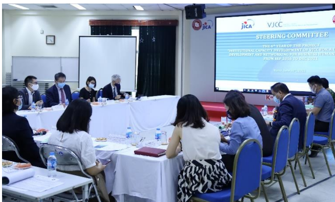
技術協力「ベトナム日本人材開発インスティテュート（VJCC）ビジネス人材育成・拠点機能強化プロジェクト」第4回運営委員会

6月30日、ハノイにて、新型コロナウイルス感染拡大の影響で延期していた、技術協力「ベトナム日本人材開発インスティテュート（VJCC）ビジネス人材育成・拠点機能強化プロジェクト」*1の第4回運営委員会を1年ぶりに開催しました。ハノイの会場にはプロジェクト関係者に加え、外国貿易大学*2（FTU）トゥアン学長、JICAベトナム事務所清水所長が参加し、また日本とVJCCホーチミンの関係者もオンラインで参加しました。