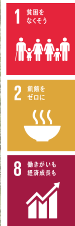
技術協力「北部地域における安全作物の信頼性向上プロジェクト（2016年7月～2021年7月）」

昨今、ベトナムでは農薬や化学肥料等の使用量が增大しており、残留農薬や微生物による汚染などへの懸念から、農産物の安全性、農産物の付加価値化、流通の透明性、市場ニーズに基づいた生産等が課題となっています。