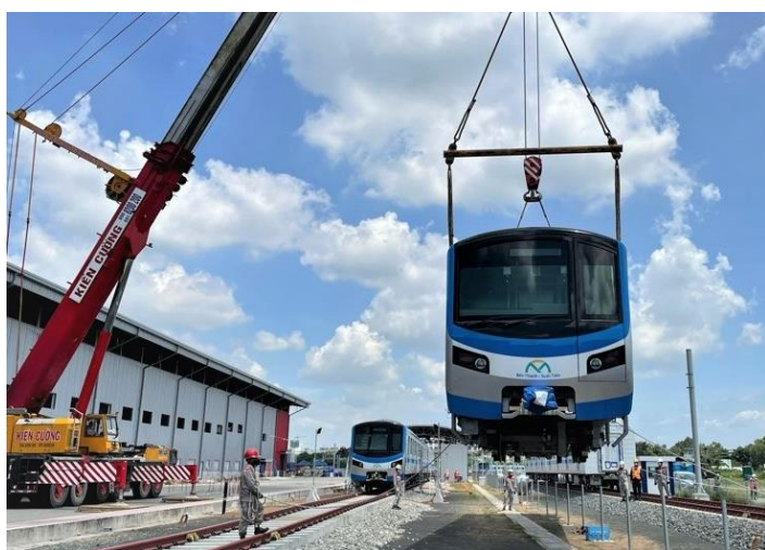
第 5 編成目の車両

6月20日、JICAの支援するホーチミン市都市鉄道1号線（ベンタインスオイティエン間）の第4編成・第5編成目の車両が、日本の山口県笠戸の工場より、ホーチミン市カインホイ港に到着しました。一編成は21日、もう一編成は23日にロンビン車両基地に搬入されました。車両は、日立製作所が製造、1編成3両で全51両を予定しています。