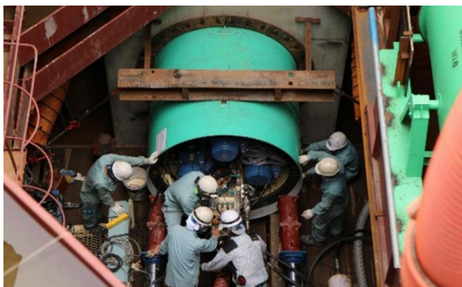
推進機を慎重に押し進めている様子

本事業で採用されている推進工法は、路面の掘削範囲が小さく、交通量の多い市街地や河川を横断するような箇所に適しており、ここハノイでも交通や市民生活への影響を抑えながら、工事を進めることが期待されています。