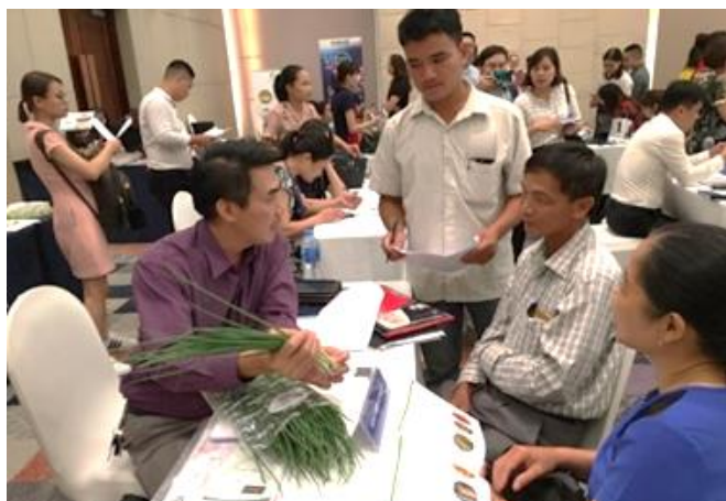
ビジネスフォーラムにおける生産者グループとバイヤーの商談

安全野菜の信頼性を高めるためには、生産者のみならず、購買者である流通業者や小売業者などサプライ・チェーン関係者が連携し、消費者のニーズを反映した安全野菜の生産・供給を行う仕組み作りが求められます。マーケティング活動では、購買者とのマッチングやシーズン終了後のレビューミーティング実施支援に加え、サプライ・チェーン関係者の相互理解と問題解決を促進する為、ハノイ市投資・通商・観光促進センター（HPA）と共同で安全作物ビジネスフォーラムを開催しました。これらの支援によりプロジェクト期間を通じて生産者 20 グループにおいて合計 132 件の新規取引が成立したことに加え、サプライ・チェーンにおける関係者の連携及び、市場需要に基づく生産計画への生産者の意識改革に繋がる試みとなりました。