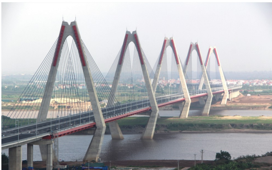
▲全長3755mのニャッタン橋。主橋長は1500m。同じ斜張橋の横浜ベイブリッジ（橋長860m）の約2倍の長さ