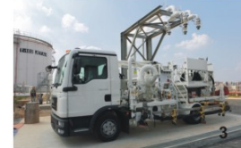
1 新技術の運用方法など、現地スタッフへの指導も徹底して行われた 2 空港内に4000ℓを貯蔵できる燃料タンク4基を設置。タンクから地下へと伸びる配管を通じて燃料が送られる 3 航空機への給油はサービスと呼ばれる特殊車両をパイパスして行われる