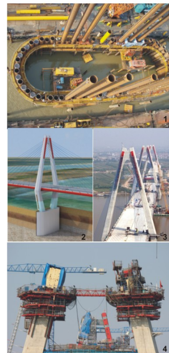
1 日本から調達された直径1.2m、118本の鋼管矢板が打ち込まれた小判型の主塔基礎 2 鋼管矢板井筒基礎は設置面積が少なく、往来する船舶交通の阻害も最小限に抑えられる 3 各主塔からバランスを固りながら架設 4 6径間連続橋では、閉合に高度な技術が求められる 主塔上部を作業中のセルフクライミング式作業床

事業名 : ニャットン橋 (日越友好橋) 建設事業 全橋長 : 3755m 主橋長 : 1500m 構造形式 : 主橋 (6径間連続合成2主1桁斜張橋)、取付橋 (スーパーT桁橋、PC箱桁橋) 工期 : 2009年4月~2014年12月末 総事業費 : 約800億円 (うち円借款供与額約542億円)