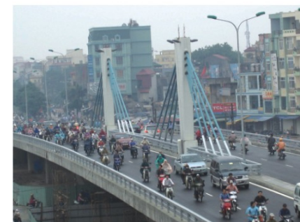
▲ガートゥーン交差点