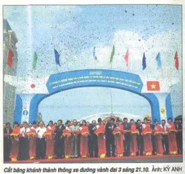
Cột băng khánh thành thông xe đường vành đai 3 sáng 21.10.

Ngày 21.10, tại Hà Nội, Bộ Giao thông Vận tải (GTVT) chính thức thông xe toàn tuyến Dự án đường vành đai III, TP. Hà Nội, đoạn Mai Dịch - bắc hồ Linh Đàm (giai đoạn 2) sử dụng vốn vay ODA Nhật Bản. Đây là đường cao tốc đô thị đầu tiên của VN thông xe với tiến độ được rút ngắn đến hơn một năm, không chỉ giúp Hà Nội sớm thoát nạn ùn tắc giao thông do xe đi qua nội đô, mà còn mở đường "lên trời" cho hệ thống đường đô thị. (Xem tiếp trang 3)