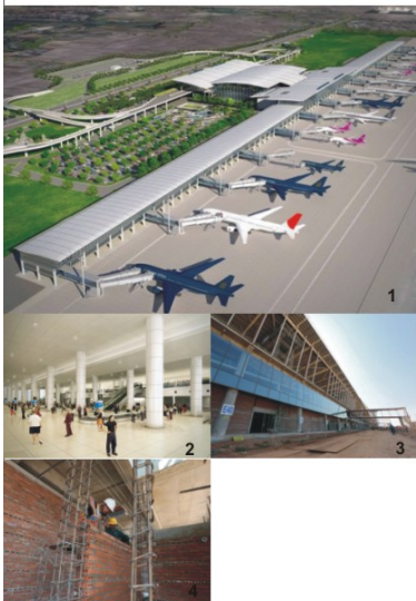
1 総床面積約15万2000㎡、96のチェックインカウンターを備える 2 ターンテーブルの数も従来と比べ増加している 3 空港の壁面にはベトナム産のレンガが使われている 4 搭乗橋は計28本。同時時間帯の離着陸にも十分な処理能力を持つ

ターミナルの建設と並行して、利用者の立場からサービスの向上が図られたのも同プロジェクトの大きな特徴だ。日本の空港会社の協力により最新の手荷物処理やセキュリティシステムの構築、空港内サービスへのアドバイスなど、ソフト面においても日本の技術やアイデアが提供された。そして、その中心に掲げられたのが、日本が誇る「ホスピタリティ」。最新の設備と最高のサービスを得て、2015年より本格的な運用が開始される同ターミナル。次のフライトでは、生まれ変わったその魅力をぜひ体感してみてください。