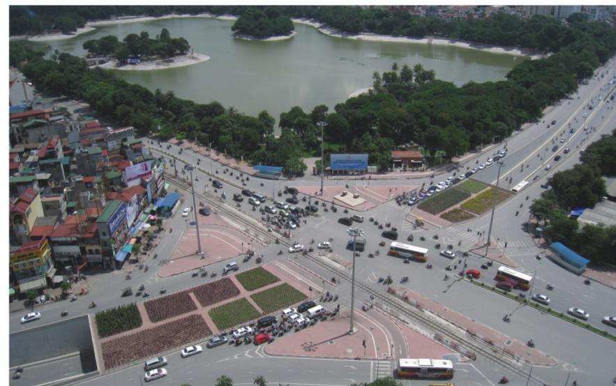
▲キムリエン交差点