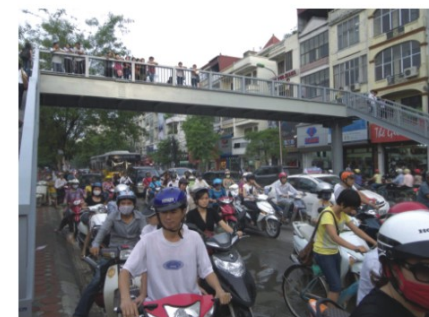
▲チュアボックスの歩道橋

なお、本事業の対象地域内の開発計画のうち工業団地開発については、JICA作成のマスタープラン（ハノイ市工業開発）に基づき計画されました。