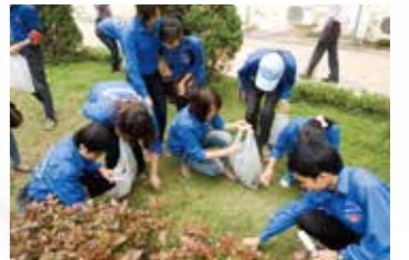
ハノイ工業大学にて5Sを実施

2016年に労働傷病兵社会省職業訓練総局によって国家プログラムとして承認されると共に、全国48の職業訓練機関から800名の参加を得て、指導員育成コースが開講されました。