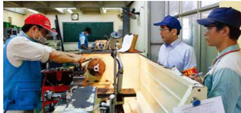
ハノイ工業職業訓練短期大学における日本式技能検定の実施風景

JICA が長年支援してきたハノイ工業大学を拠点に日本式職業訓練モデルを展開し、カリキュラム改善、就職支援、日本式技能検定の活用などを支援します。