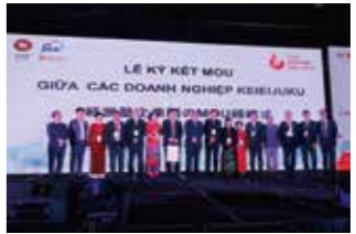
経営塾創設10周年記念式典

本プロジェクトは、ハノイ市、ホーチミン市にVJCCを設立し、日本式経営の知見を持ったビジネス人材の育成を行うことで、日越間の経済関係の強化に貢献するものです。特に、経営層向けビジネス人材育成コース「経営塾」は、10か月間、月5日で経営戦略・人事・マーケティング・ものづくり等の科目を通じ日本的経営を学ぶコースで、2019年に創設10周年を迎えました。既に400名を超える修了生は同窓会を形成し、現地における日本企業のビジネスパートナーとして活躍しています。