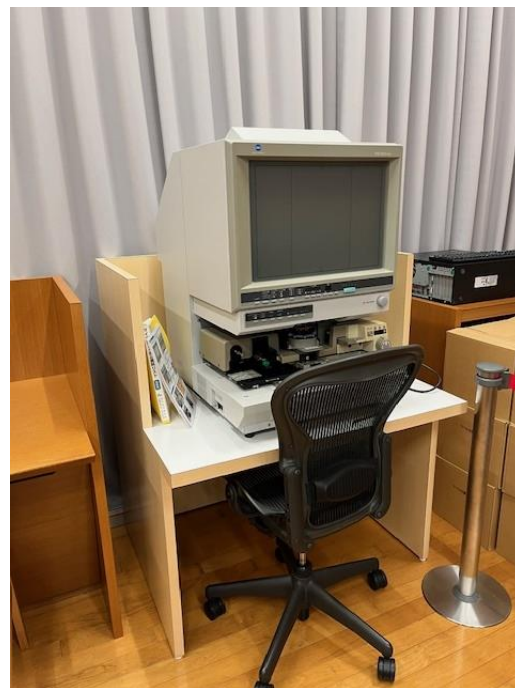
現行機器の設置状況