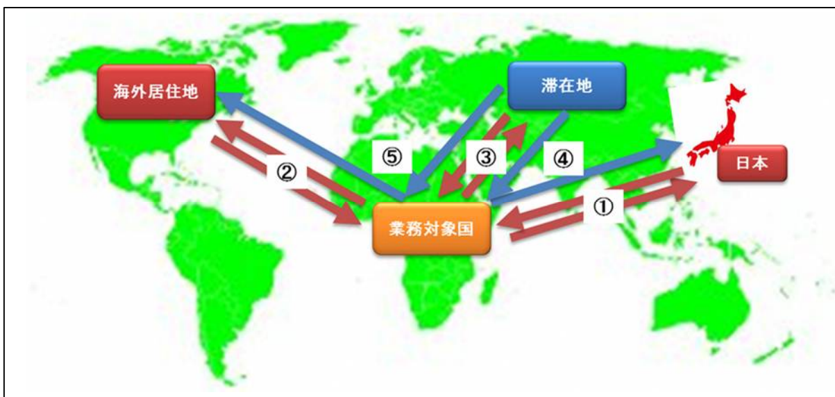
図3 経路別航空賃計上可能範囲説明図

b) 出発地と帰着地とが異なる場合（上記ケース④⑤を除く。）は、原則として往路（出発地→業務地）のみ計上を認め、復路（業務地→帰着地）の計上は認めません。