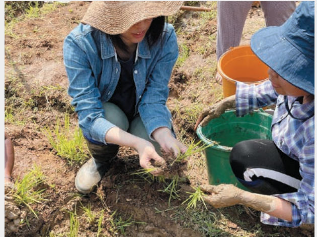
2022年度新入職員研修の一環で実施した海外OJTの様子(マダガスカルでの稲作プロジェクトで現場を体験)

加えて、障害のある職員等も積極的に雇用し、意見交換会や全スタッフ対象の社内研修などを通じて、障害のある職員等にとって働きやすい職場づくりに努めています。