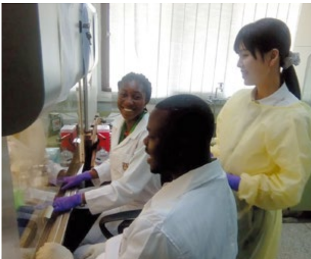
ガーナ：日本人研究員がガーナ大学野口記念医学研究所の研究員に研究手法を伝える（ガーナにおける感染症サーベイランス体制強化とコレラ菌・HIV等の腸管粘膜感染防御に関する研究）