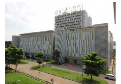
大学付属病院の外観