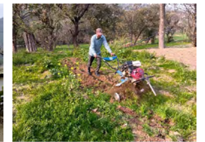
小規模農家の耕起作業・農業機械の活用の様子(マンディ県)