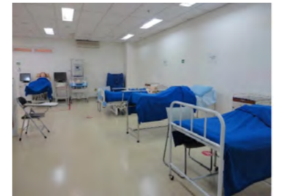
インドネシア大学の総合看護実習室