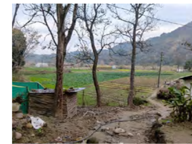
揚水灌漑地区の様子(ハミルプール県)

以上より、本事業の評価は高いといえる。ただし、施設管理が不十分な地域もあることから、実施機関には整備された小規模灌漑施設等の持続可能な運用・維持管理支援とプロジェクト管理ユニット(PMU)への農業局職員の配置を提言した。JICAには、水利組合を支援するための農業局の役割と責任の明確化とモニタリング等の実施可能な体制の整備について、農業局との調整を図ることを提言した。また、本提言を踏まえ、事業対象地域内の農家が必ずしも同質的ではないため、個別農家経営の視点に立った作物多様化支援の必要性について教訓を導出した。