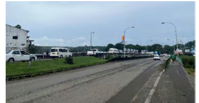
拡幅した新マタニコ橋(奥側が拡幅した2車線)