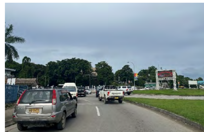
改修した道路と改良したラウンドアバウト

側溝や排水路の清掃頻度の不足により雨天時の道路冠水が起こっているが、改善に向けた予算確保のための財務省との調整はついていない。また、渋滞解消策の