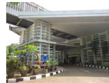
インドネシア大学保健科学部の入口

は故障機器の修復や民間との連携による空きフロアの活用・新サービスの導入を提言する。本事業でインドネシア初の免震機能(地震対策)を備えた大学付属病院が整備され、教育・研究・医療サービスを統合したモデル病院へと発展した。本事業から得られた教訓として、相手国や他ドナーの動向を踏まえた戦略的計画が重要であり、教育・研究・医療サービスの一体運営、学際的連携、データ活用、政策提言力の強化が持続可能な高等教育・医療のモデルケース構築の鍵となることが挙げられる。