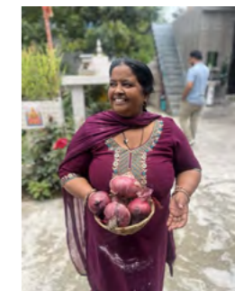
事業を通じて農業に参画した女性と大きく立派に育った玉ねぎ(カングラ県)