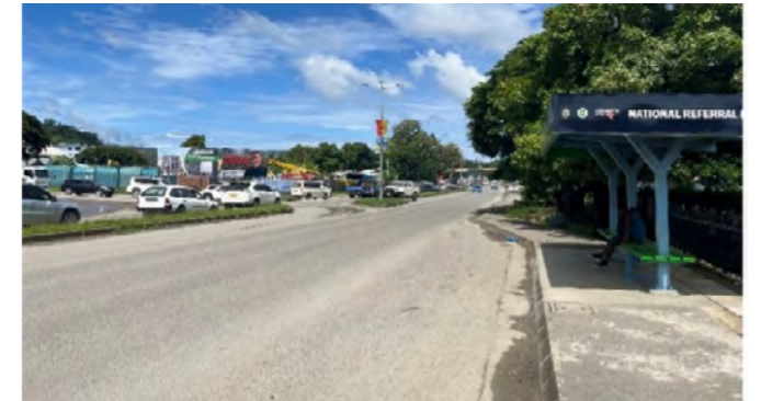
改修したククム幹線道路及び設置したバスベい

側溝や排水路の清掃の頻度を上げるため、MIDは早急に予算を確保することが求められる。また、ホニアラ市役所とも連携の上、ゴミのポイ捨てをなくすための啓発活動等を行うことが重要である。さらには、JICA「ソロモン国ホニアラ都市交通管理能力向上アドバイザー業務」と連携し、乗客待ちのバスで溢れかえる中央市場前のバスベいの現状に対する改善方策を検討し、対策を講じていくことが重要である。