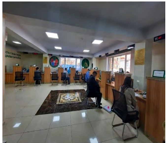
手続きの簡略化とオンライン化が図られたチンゲルテイ区社会保険事務所

社会保険庁職員の年金財政検証能力(年金数理)に関して、本事業(2016年～2020年)で基礎的理解の向上を図り、それを土台として、国別研修「社会保険分野における財政検証実務能力強化」(2020年～2023年)が行われました。これにより、基礎的理解は実務で十分活用できるレベルにまで高まり、財政検証能力は推計業務や各種調査に日常的に活用され、事業効果の継続や技術的持続性の向上に貢献しています。このように、技術協力プロジェクトを研修やその他の事業でフォローアップすること、すなわちプログラムのアプローチを採ることは、事業効果の継続や持続性の向上に寄与することが確認されました。