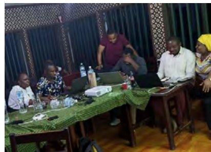
病院の計画策定支援を目的とした、病院経営層対象の研修(2022年、マウェニ州レファラル病院)

本事業実施中、COVID-19の感染拡大により、州レファラル病院では、患者が減少する等の影響を受けましたが、事業効果の持続性を確保するための体制構築に重点を置いて活動すると共に、日本人専門家が不在の間、現地専門家が州レファラル病院の戦略策定を支援し、品質管理活動のモニタリングを綿密に行う等の工夫により、その影響を早期に克服し、病院収入は2021年以降増加に転じました。事業形成時に実施機関カウンターパートと現地専門家の能力強化とオーナーシップ向上を事業デザインに組み込む重要性が確認されました。